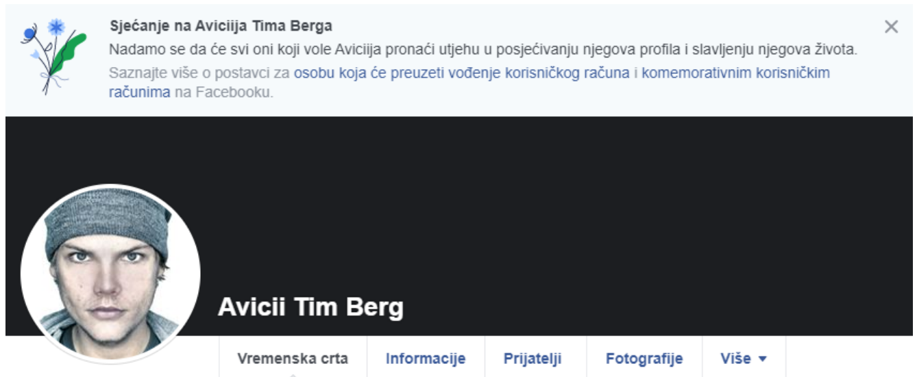
Slika 3. Facebook stranica Aviciiija Tima Berga

je danas, procijenjuje se, oko 30 milijuna profila preminulih osoba. Ponašanje njihovih prijatelja i korisnika MySpacea je proučavao student Jed Brudbaker te je objavio i znanstveni rad na temu ‘Smrt i društvene mreže’, piše Tehnoklik. – Ono što me posebno iznenadilo je to da smo vidjeli kako se ljudi vraćaju i nastavljaju komunicirati s mrtvim ljudima iz godine u godinu., 20 Facebook je upravo zato i pokrenuo mogućnost memorijskih profila. Na vrhu profila pisati će „Sjećanje na...“, a ovisno o postavkama privatnosti računa, osobe će na profil moći objavljivati svoje uspomene na tako zvanu komemorativnu vremensku crtu.