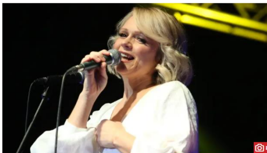
Slika 7.1. Članak na 24sata.hr : „Imala sam iskustva koja su bila vezana uz seksualno nasilje...”

Piše Astrid Čada, utorak, 17.9.2019 u 20:45