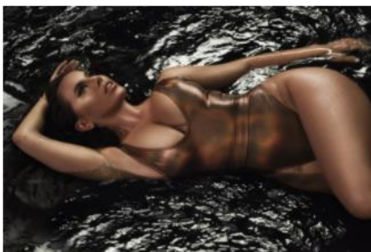
Slika 8.2. Članak na Story.hr: „Nives Celzijus: 'Udvarače odbijam na dnevnoj bazi'“

Taman kad čovjek pomisli da ovo ljeto ne može biti toplije, nastane još veći pakao kad Nives ubode novi hit. Atraktivna pjevačica naše Celzijuse podigla je do rekordnih usijanja objavom provokativnog video spota za novu pjesmu 'Odjebando'. Njezine bujne obline prite na sve strane, a mnogi obožavatelji umjesto osvježenja mogu doživjeti tek srčani udar. Ali, takva je Nives Celzijus: umjesto olakšanja, donese još veći pritisak. Nekome po tlakomjeru, a nekome u životu. Ona ništa ne prepušta slučaju. Gore zato danas društvene mreže zbog naše estradne ikone seksipila. Jer, ovako 'vruć' spot, slažu se mnogi, vatrena Nives dosad nije objavila. Na vrlo simboličan način prvi je put prihvatila i neki novi glazbeni izričaj.