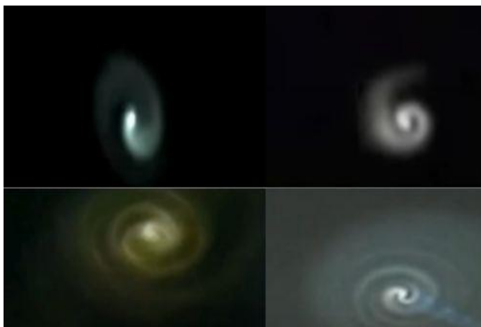
Slika 3: Plazma u atmosferi – lijevo gore: Australija 2010.god., desno gore: Rusija 2006.god, lijevo dolje: Kina 1988.god., desno dolje: Norveška 2010.god.