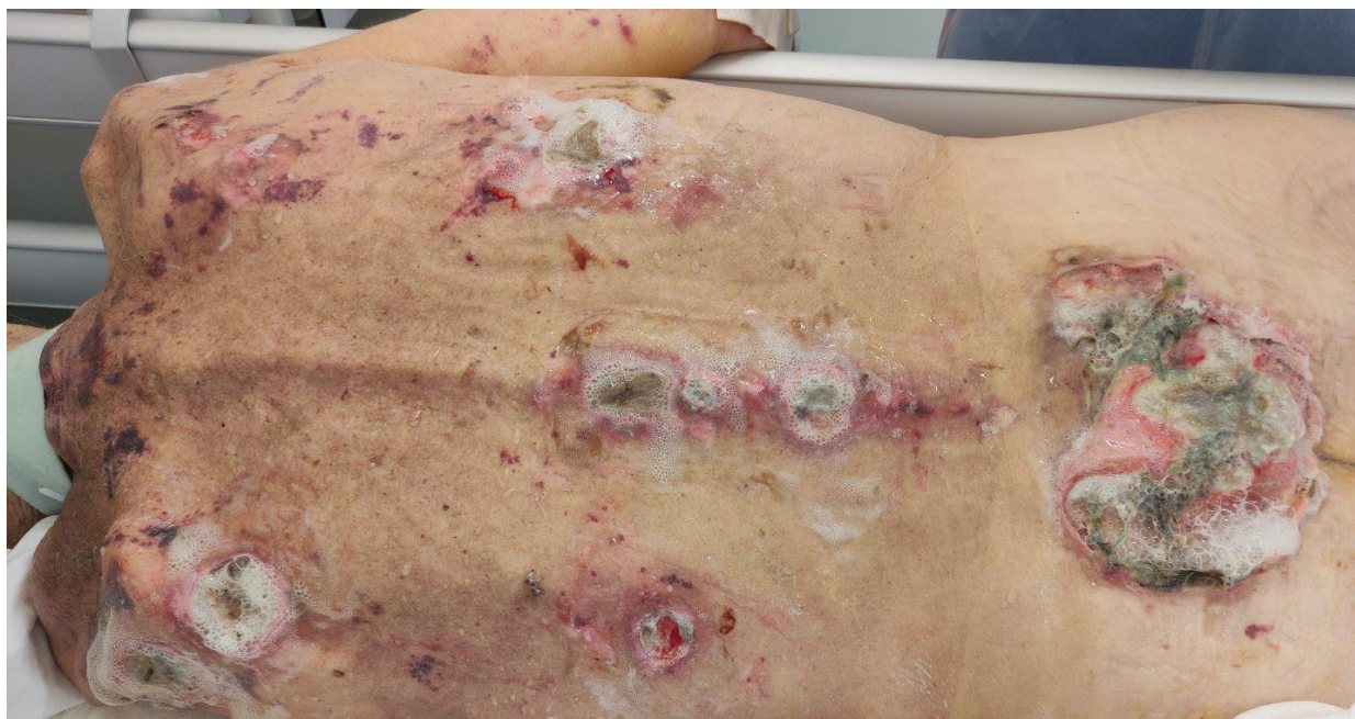
Slika 6.2. Kronične rane (dekubitusi) tretirani 3% vodikovim peroksidom