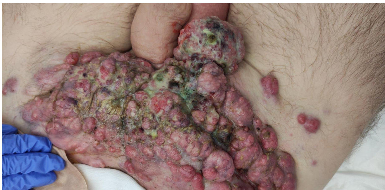
Slika 3.4.3. Maligna rana

Kod malignih rana uobičajeno je i krvarenje. Bilo koji obloga ili zavoj koji dolazi u neposredni kontakt s površinom maligne rane, prilikom skidanja mogu oštetiti površinu rane. To se može spriječiti pomoću mrežice od sintetičkih polimera te neprijanjajućih obloga za ranu [15].