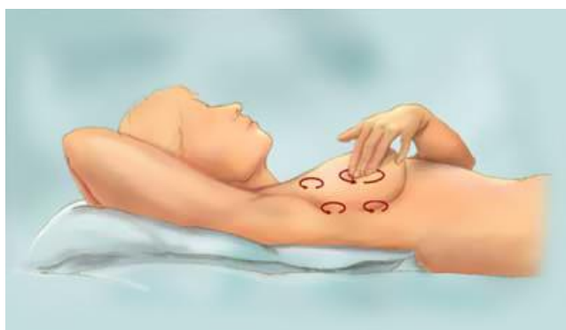
Slika 5.1.2.2. Palpacija u ležećem položaju

Dojku je podijeljena na četvrtine ili kvadrante zamišljajući okomice kroz bradavicu. Razlikujemo gornji unutarnji, gornji vanjski, donji unutarnji i donji vanjski kvadrant. Svaku kvadrant dojke treba popipati temeljito u dva smjera, a tek nakon pregleda svih kvadranta pojedinačno treba pipati cijelu dojku. Kružnim pokretima u smjeru kazaljke na satu, a potom u suprotnom smjeru. Samopregled još obuhvaća palpaciju limfnih čvorova i kontrolu eventualnog iscjetka iz dojki. [9]