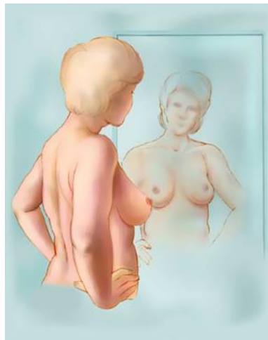
Slika 5.1.1.1. Inspekcija kada ruke obuhvate struk

Kod inspekcije treba dobro pogledati dojke u ogledalu. Pregledava se izgled kože i bradavica, pomičnost dojki kod podizanja obje ruke. Stati ispred ogledala i pažljivo promotriti dojke. Najprije sprijeda kada su ruke ispružene uz tijelo. Promatrati dojke najprije iz prednje strane, a zatim s boka. Zatim s obje ruke obuhvati struk te u tom položaju promatrati dojke kao što je prikazano na slici 5.1.1.1.