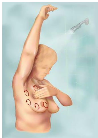
Slika 5.1.2.1. Palpacija u stojećem položaju