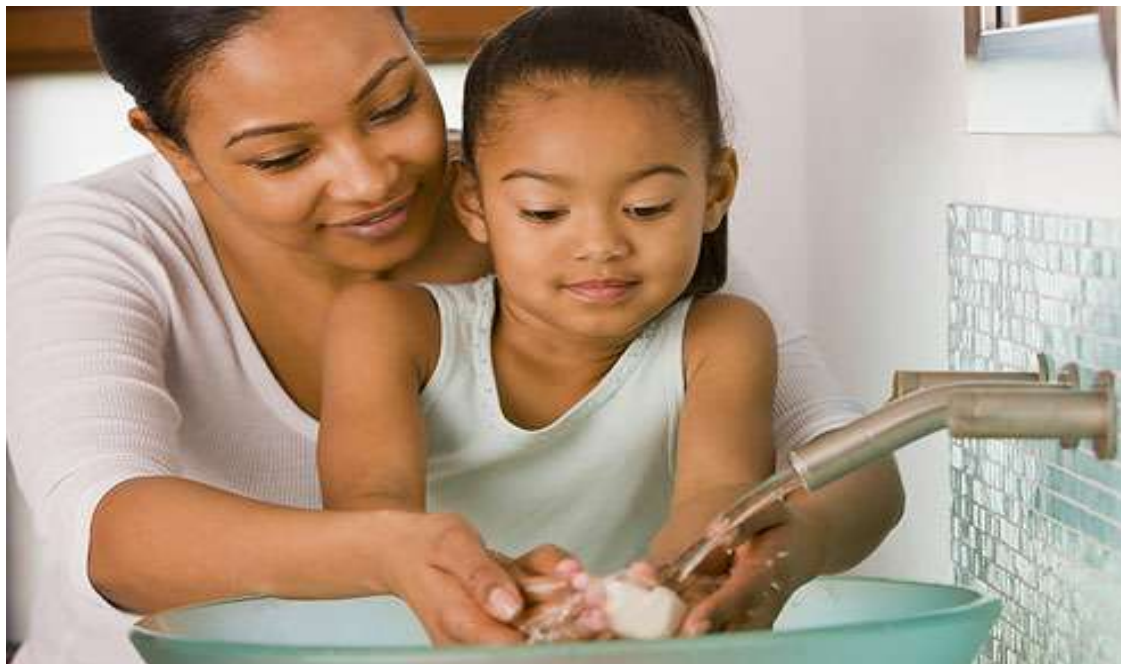
Slika 5.9.1. Zdravstveni odgoj djece

naviku pranja ruku prije i nakon obavljanja nužde. Slika 5.9.1. prikazuje zdravstveni odgoj djevojčice. U djece treba razvijati i pravilne navike u prehrani. [18]