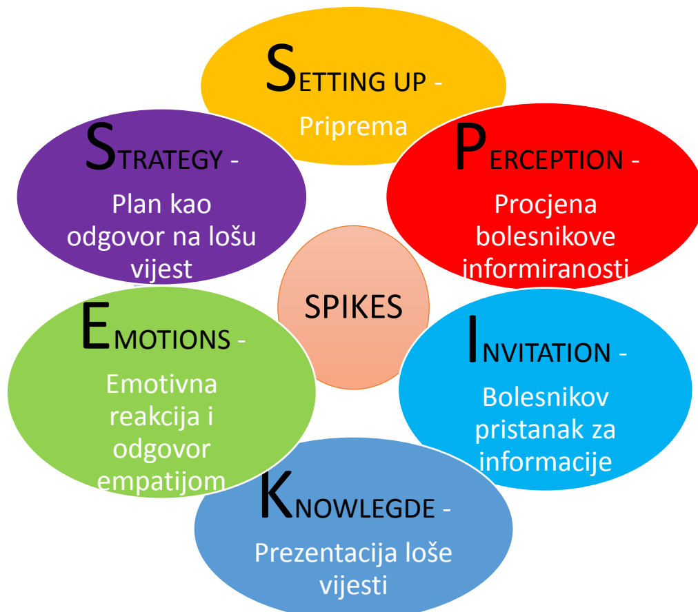
Slika 3.2.1. SPIKES protokol

SPIKES protokol koji se primjenjuje prilikom priopćavanja loših vijesti služi kako bi se prikupile informacije, prenijela medicinska saznanja, pružila podrška bolesniku, pridobilo njegovo povjerenje za daljnju suradnju i na kraju izradila strategija za buduće intervencije. Pomoću šest smjernica ovaj protokol pomaže zdravstvenom djelatniku da bi svaki korak odradio upotrebljavajući specifične vještine potrebne kako bi saopćavanje prošlo što bolje [12].