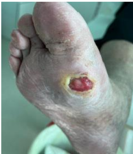
Slika 8.2.2.1. Prikaz dijabetičkog stopala

nezacjeljivih ulkusa, amputacije donjih udova i smrtnosti. Također može dovesti do razvoja dijabetičkog stopala [36]. Dijabetičko stopalo je među najčešćim komplikacijama bolesnika sa šećernom bolesti. Temeljni uzroci su loša kontrola glikemije, žuljevi, deformiteti stopala, nepravilna njega stopala, neprikladna obuća, suha koža i mnogi drugi. Najčešće se javlja u području plantarne metatarzalne glave, pete i vrhovima čekićastih prstiju. Prognoza je dobra ako se rano identificira i započne optimalno liječiti. Najstrašnija komplikacija koja se može javiti je amputacija ekstremiteta, a druge komplikacije mogu biti gangrena stopala, osteomijelitis, trajni deformitet i rizik od sepse. Edukacija bolesnika je najvažnija preventivna mjera u sprječavanju razvoja dijabetičkog stopala. Bolesnika treba upoznati s važnošću dobre kontrole glikemije, pravilne njege stopala, izbjegavanju duhana i redovitim kontrolnim pregledima [37]. Prikaz dijabetičkog stopala na slici 8.2.2.1.