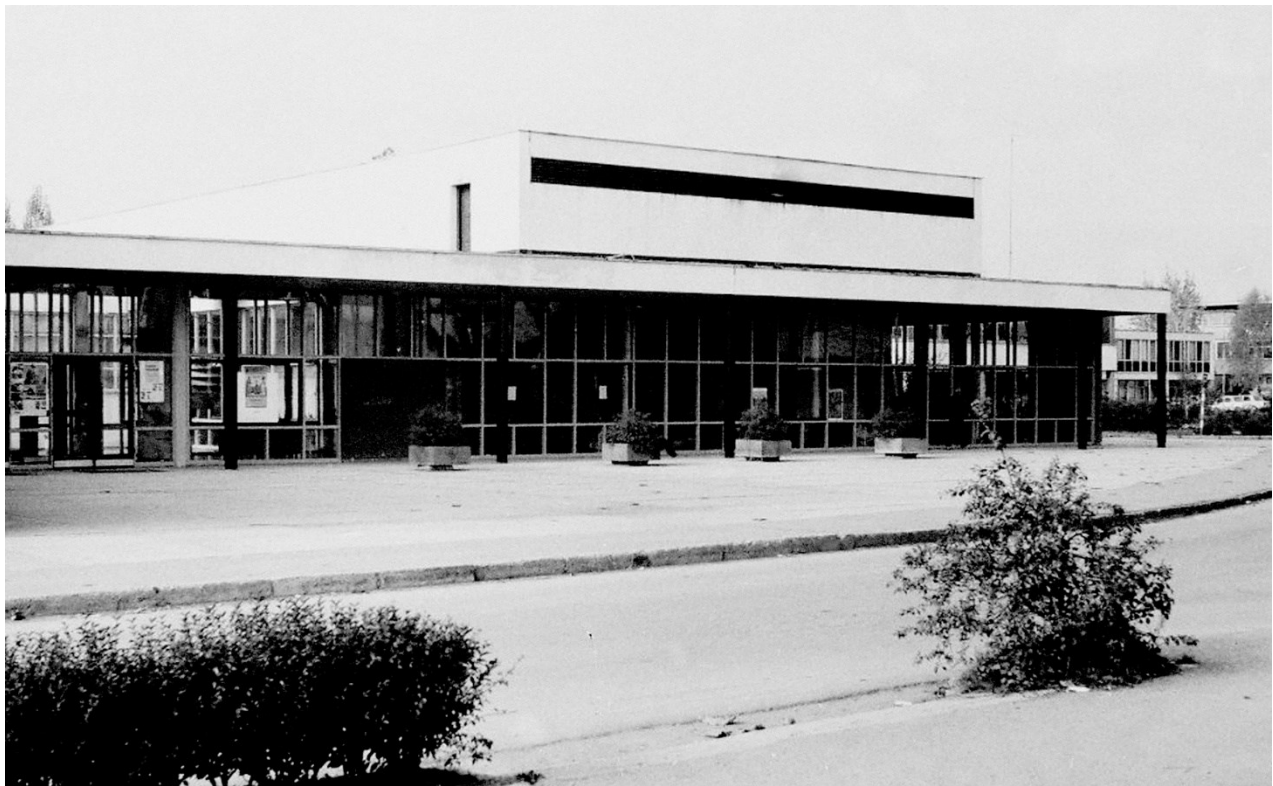
Slika 8. Knjižnica i kino dvorana godine 1965. iz zbirke Arhitektura u Ivanić-Gradu '60 – '85 ( https://industrijska-bastina.com/knjiznica-i-kino-dvorana/ ; pristupljeno 07.08.2023.)

Prvi istraživački radovi u ivanićkom kraju datiraju s početka 20. stoljeća. Inicijalna potraga za naftom rezultirala je pronalaskom prvih kapi nafte iz ovog kraja 1949. godine kada je u proizvodnju pušteno prvo od sedam naftnih polja koja djeluju na širem području Ivanić-Grada, polje Križ-Šumećani. Krajem 1962. godine otkriveno je, 3046 metara dubokom bušotinom, polje Ivanić te je u studenome 1963. godine počelo s radom cijelo naftno polje Ivanić. 60-tih i 70-tih godina osnivaju se brojne tvrtke na području grada: MEBA; kasnije Ivanićplast, Ivasim; kemijska industrija, TMPK; metaloprerađivačka industrija, ANTILOP; tekstilna industrija, 6.MAJ, kasnije Ivakarton, kartonaža, Agroposavina i brojne druge. Industrijalizacija je donosila napredak i blagostanje, gradile su se nove škole i vrtići, trgovački centri, upravna središta i industrijska postrojenja, u polu ruralnim sredinama dizale su se prve stambene zgrade modernih vizura. Ivanić-Grad je bio kolijevka izobrazbe radnih ljudi, raznih struka i razina, za potrebe cijelog nekadašnjeg INA-Naftaplina i drugih tvrtki koje su mijenjale gospodarski razvoj grada.