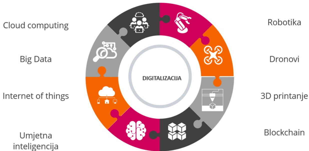
Slika 1. Prikaz digitalizacije