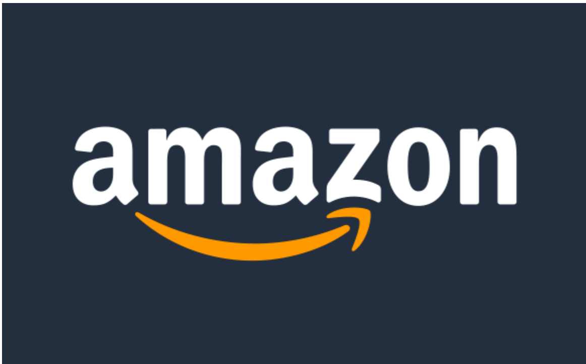
Slika 2. Prikaz Amazon logo-a