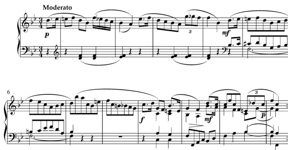
Slika 4.2.1. Početak Varijacije I (||: a :||, taktovi 1-12)

Prva varijacija u B-duru također je trodijelnog oblika (||: a :||: b a :||) i predstavlja formalnu varijaciju strogog tipa. Rikard Schwarz u prvoj varijaciji razrađuje cijeli Mozartov prvi Menuet s