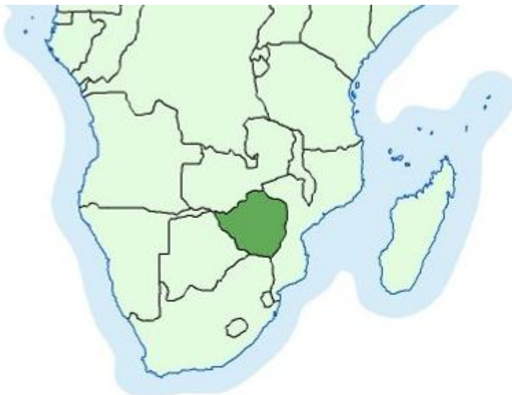
Slika 4 Karta položaja Zimbabve 4

Prema podacima iz 2000. godine Zimbabve je jedna od najsiromašnijih zemalja svijeta. U 2008. godini ostvario je BDP od oko 200 $ po stanovniku, ima stopu nezaposlenosti oko 65 % i 15 % stanovništva oboljelo je od HIV bolesti. Udio poljoprivrede u BDP-u 1990. godine iznosi oko 14 %, a za poljoprivredu je direktno vezano 27 % radno sposobnog stanovništva. U ukupnom izvozu oko 40 % su gotovi proizvodi kao što su tkanine, čelik i drugi metali. Najvažnija izvozna roba je duhan, koji čini više od 20 % ukupnog izvoza. Zlato je na drugom mjestu roba važnih