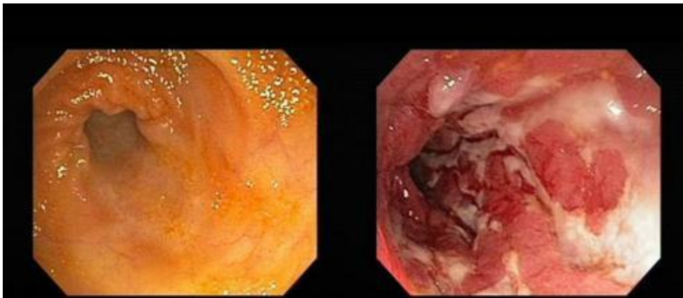
Slika 7.1.1 - Endoskopija tankog crijeva - na prvoj slici je normalno tanko crijevo, a na drugoj slici tanko crijevo zahvaćeno Crohnovom bolesti.

Kliničke manifestacije su mnogo raznolikije nego kod ulceroznog kolitisa, zbog zahvaćanja cijele stjenke crijeva te zbog različitog zahvaćanja crijeva. Pacijenti mogu imati simptome mnogo godina prije postavljanja dijagnoze, a zbog nespecifičnih se simptoma često sumnja na sindrom iritabilnog crijeva.[9]