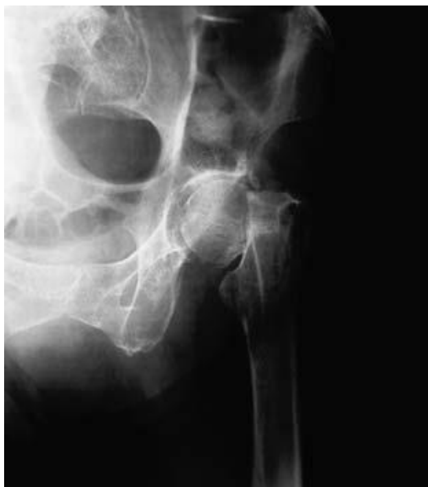
Slika 3.1.1 Impaktirani prijelom vrata femura

koji su povezani sa starenjem (osteoporoza, povećanje nagiba vrata femura), slabljenje psihofizičke sposobnosti (neuromuskularna inkordinacija, strah od aktivnosti) i prateće bolesti, udruženi daju visoku vjerojatnoću prijeloma kuka (slika 3.1.1) u starijoj životnoj dobi. Primijećeno je da se zimi desi više prijeloma kuka nego u ostalim godišnjim dobima. Broj takvih povreda konstantno raste zbog povećanja duljine života i posljedično tomu pratećih bolesti, neuromuskularne inkordinacije i ostalih rizičnih čimbenika. Udio starijih osoba u cjelokupnoj populaciji postaje sve veći, sadašnji prosjek starosti muškarca sa prijelomom vrata femura je 72, a žena 77 godina. [9]