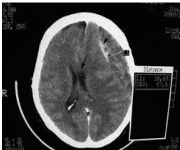
Slika 3.3.1.1 Kronični subduralni hematom

Traume mozga kod starijih osoba nazvane su tiha epidemija, često se simptomi pripisuju demenciji što dovodi do krive dijagnoze i krivog liječenja takvog pacijenta. [7]