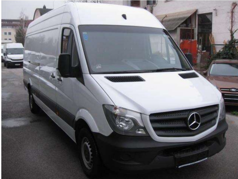
Slika 3.3 Kombi vozilo

Izvor: http://www.strobi.hr/ponuda-rabljenih-vozila/detalji/?vozilo=359