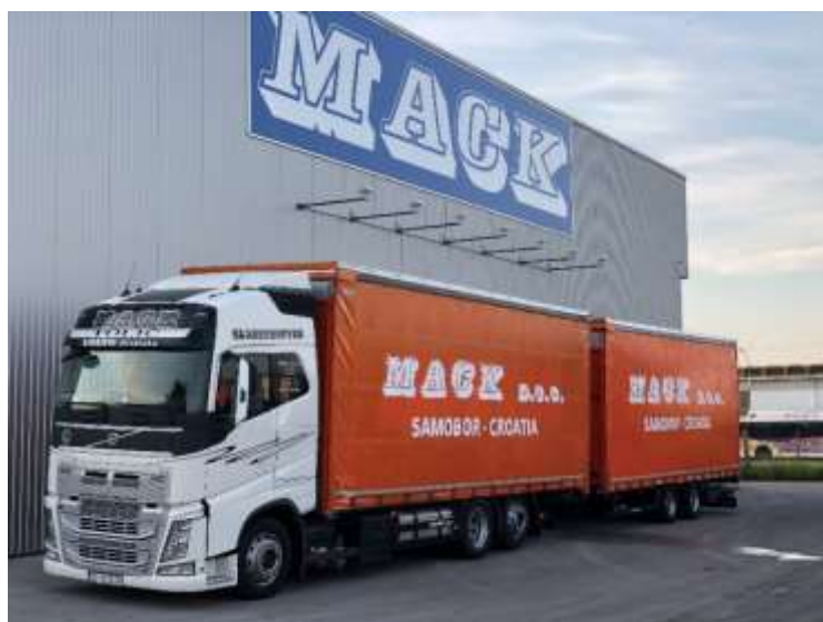
Slika 3.5 Kamion s prikolicom