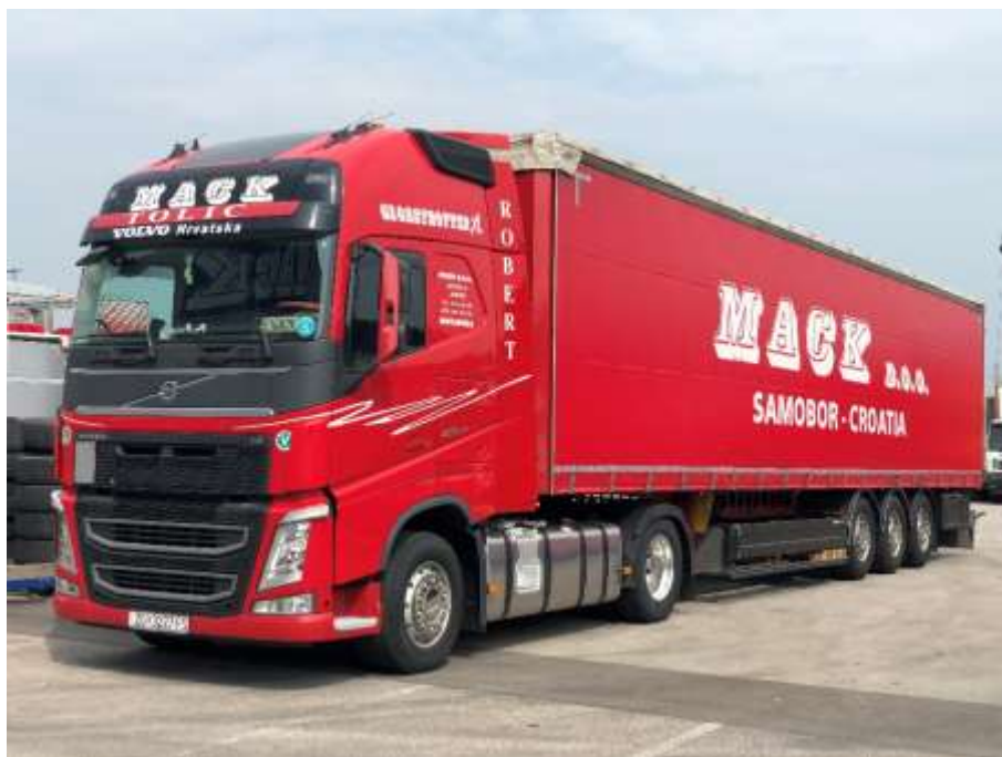
Slika 3.6 Tegljač s poluprikolicom