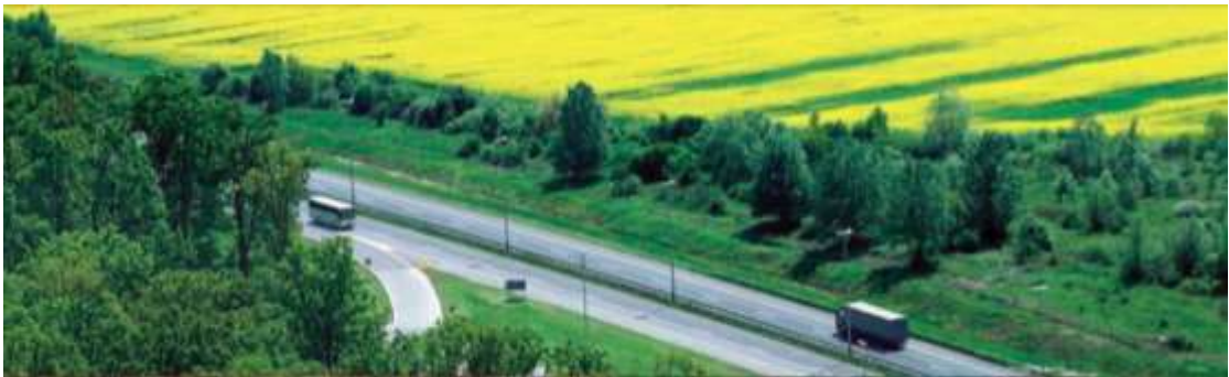
Slika 2.1. Autocesta