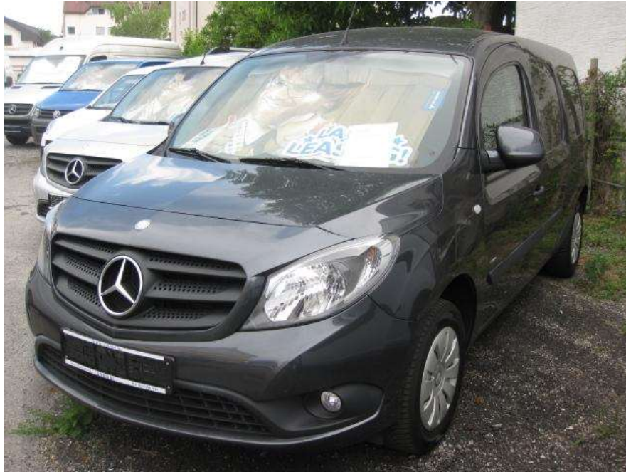
Slika 3.2. Dostavno vozilo

Izvor: http://www.strobi.hr/ponuda-rabljenih-vozila/detalji/?vozilo=341