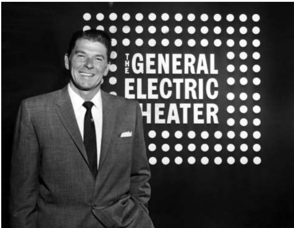
Slika 4.1. Ronald Reagan kao voditelj The General Electric Theatera

„Ronald Reagan, američki glumac i predsjednik Udruženja glumaca Amerike u aktivnu politiku ulazi nakon demobilizacije poslije Drugog svjetskog rata. Kao političar zalagao se za konzervativni pokret s novom vrstom vodstva, bolje opremljenim za novo – televizijsko doba, u kojem je slika kandidata jednako važna kao i njegove riječi i ideje. Tijekom pedesetih godina prošloga stoljeća Reagan koristi svoju slavu, šarm i komunikacijske vještine da bi pomogao u izgradnji konzervativnog pokreta, iako je tridesetih godina u Hollywood došao kao liberalni demokrat, ubrzo nakon svršetka Drugog svjetskog rata mijenja političku orijentaciju tvrdeći kako politiku New Deal-a vidi kao prijetnju temeljnim američkim vrijednostima.“ (Ross 2011:132). Ross smatra kako je Reaganova pozicija kao predsjednika Udruženja glumaca tijekom turbulentnih godina HUAC-ovih saslušanja učvrstila kod njega antikomunističke stavove, koji su ujedno postali osnovni element njegovog političkog vođenja Amerike.