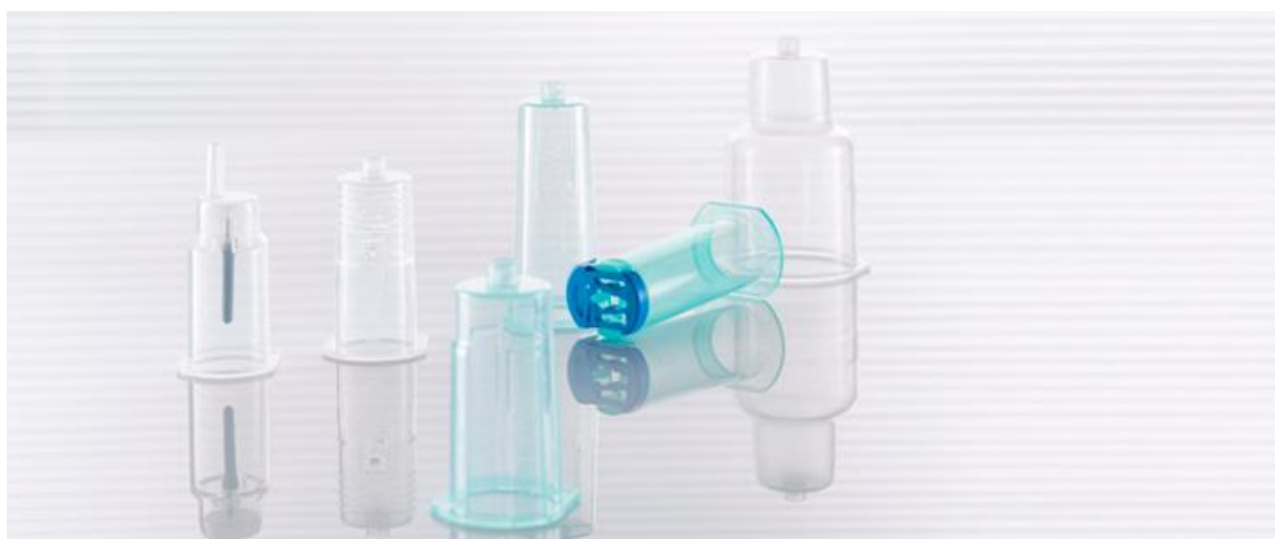
Slika 6.3. Držači (holderi) igle/epruvete