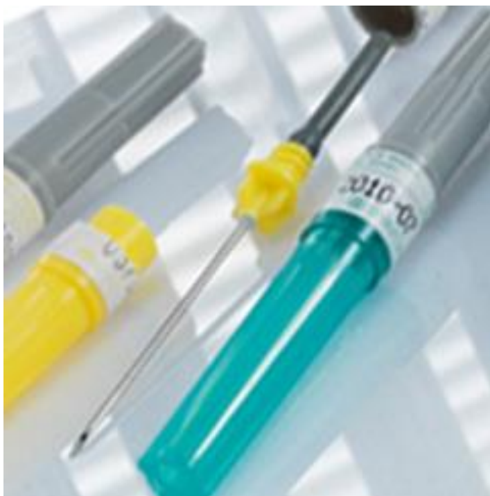
Slika 6.1. Vacurette® igle