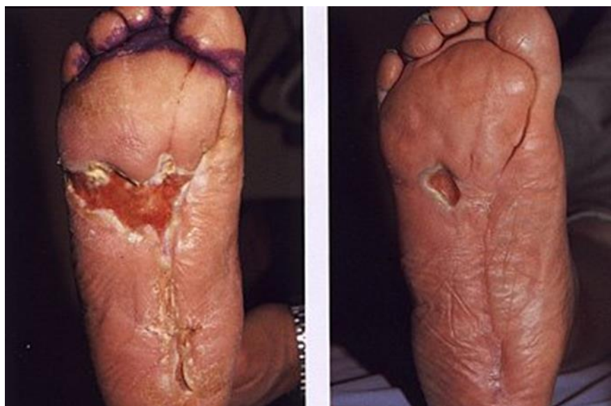
Slika 6.1.2.2. Rezultat nakon 4 mjeseca