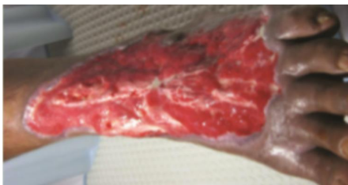
Slika 7.3. Dijabetičko stopalo nakon 2 tjedna i 10 serija HBOT