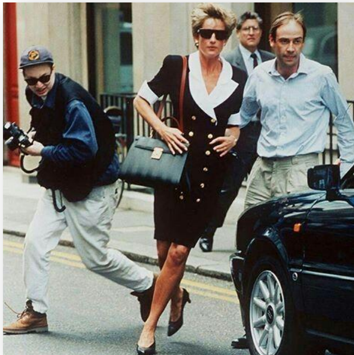
Slika 3.1. Princeza Dijana pokušava pobjeći od paparazza (izvor: https://www.pinterest.com/pin/661818107715253202/?lp=true )