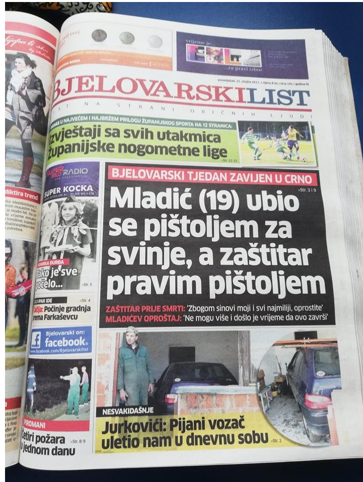
Slika 4: Bjelovarski list, objavljen dana 21. ožujka 2011. godine

Naslovnica od dana 21. ožujka 2011. godine iznenađuje svojim senzacionalističkim naslovom, kao što je vidljivo na fotografiji.