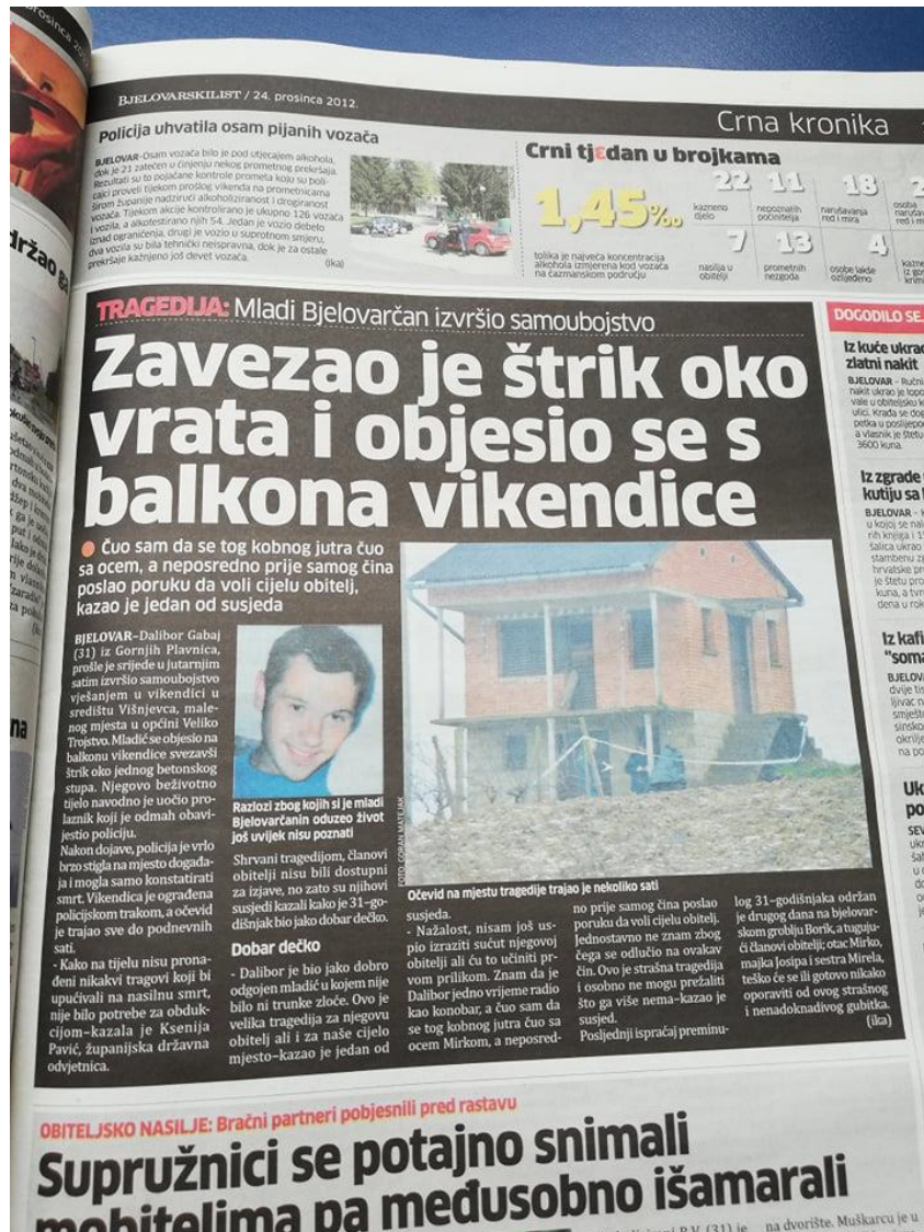
Slika 7: Bjelovarski list, objavljen dana 24. prosinca 2012. godine

Posljednja vijest u 2012. godini, govori o tragediji u kojoj je mladić izvršio samoubojstvo. Detalji su vidljivi na fotografiji ispod teksta. Na fotografiji je lako uočiti nedostatke i pogreške novinara Bjelovarskog lista.