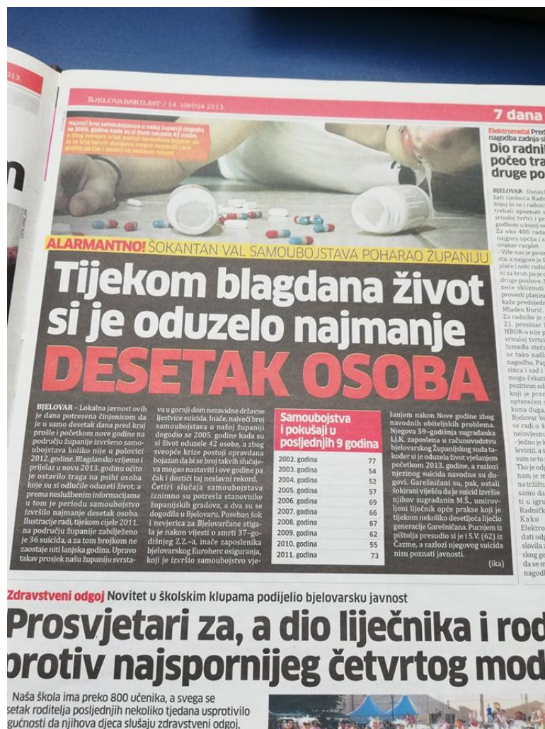
Slika 8: Bjelovarski list, objavljen dana 14. siječnja 2013. godine

U Bjelovarskom se listu tijekom 2013. godine šest puta pisalo na temu samoubojstava. Prva vijest, od njih šest, nosi naslov: „ Tijekom blagdana život si je oduzelo najmanje desetak osoba “, a objavljena je 14. siječnja. Vijest se nalazi u rubrici 7 DANA, na petoj stranici tjednika. Uz vijest o tome kako si je na kraju 2012. godine život oduzelo više osoba, negoli je to bilo kroz čitavu spomenutu godinu, donosi i uznemirujuću fotografiju, vidljivu ispod teksta. Uz fotografiju, tjednik nudi i popis samoubojstava i pokušaja istog u razdoblju od 2002. do 2011. godine.