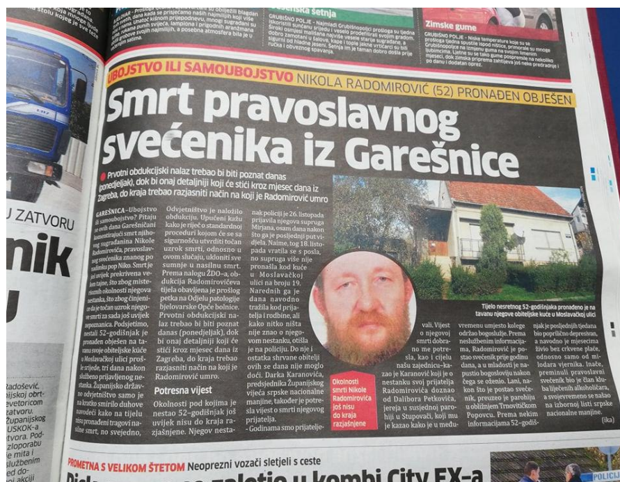
Slika 6: Bjelovarski list, objavljen dana 05. studenog 2012. godine

U studenom, na sreću, možemo pronaći samo jednu vijest koja donosi vijest o samoubojstvu. Naslovnica donosi pogrdan i iznenađujući naslov: „Garešnički pravoslavni pop pronađen obješen na tavanu.“ U pravilu, riječ pop pogrdna je, pravilno bi bilo napisati svećenik ili paroh . Ispravak se uviđa već na trećoj stranici tjednika. Detalji vidljivi na fotografiji.