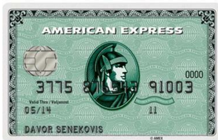
Slika 1. Reklamna fotografija American Express kartice