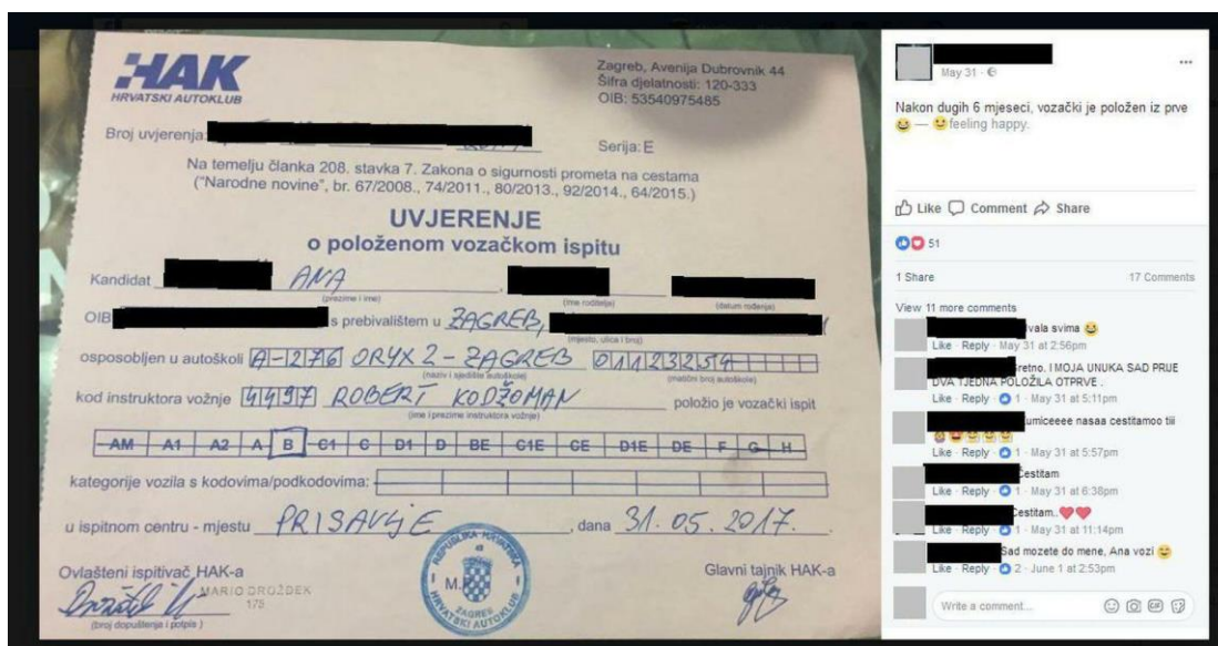
Slika 2. Primjer osobnog podatka preuzetog sa Facebook-a objavljenog u ZIMO-u.

Svakodnevno u medijima možemo naići na nečije osobne podatke, pogotovo u slučaju kada isti mediji ne uspiju pronaći više informacija o osobi koju obrađuju. Korištenje osobnih podataka u medijima je posebno vidljivo u tabloidima. U slučaju da se ovo dogodi, osoba koja misli da je joj povrijeđen ugled, kontaktira AZOP. Nakon toga AZOP detaljno analizira poslan sadržaj, te uvidom zaključuje radi li se o povredi ili ne, ali sve se utvrđuje Općom uredbom o zaštiti podataka. Ako se ne radi o povredi temeljenoj na zakonu, povrijeđeni ima pravo zamolbom za uklanjanje svojih podataka obratiti se internetskim portalima ili nekom drugom mediju.