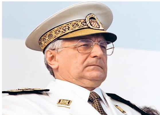
Fotografija 3: Prvi Hrvatski predsjednik Dr. Franjo Tuđman, preuzeto sa

Iako se smatra da je HDZ najstarija hrvatska stranka, povjesničari navode da to nije istina budući je početkom raspada Socijalističke Federativne Republike Jugoslavije, prva stranka koja je osnovana bila Hrvatska socijalno-liberalna stranka (HSLŠ). Dunatov (2010:388) navodi da je tek nakon toga dana 17. lipnja 1989. godine, utemeljena Hrvatska Demokratska Zajednica. Njezin utemeljitelj je Franjo Tuđman, ujedno i prvi predsjednik Republike Hrvatske. Na prvim višestranačkim izborima u Republici Hrvatskoj održanim 22. travnja 1990. godine, odnosno u drugom krugu održanom 6. svibnja 1990. godine, na koje je izašlo 80 posto birača, navedena stranka je osvojila 42 posto glasova. Navedena stranka je inicirala i prvi referendum u Republici Hrvatskoj održan 19. svibnja 1991. godine u kojemu je većinskom odlukom glasača Hrvatska raskinula sve do tadašnje veze sa takozvanom SFRJ.