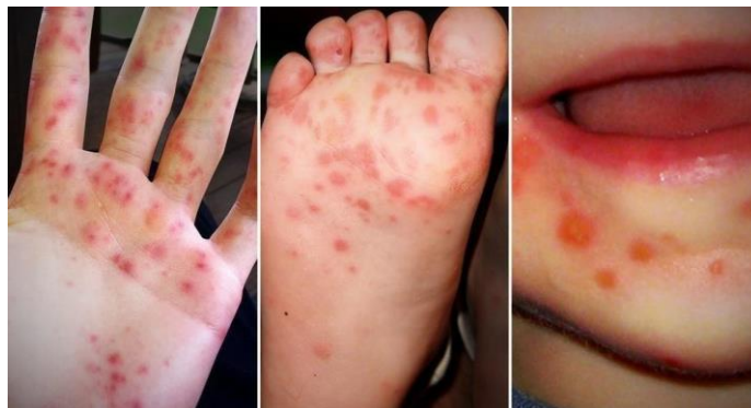
Slika br. 4.1. Prikaz osipa kod bolesti šake, stopala i usta

Od trenutka kada je dijete izloženo bolesti, potrebno je 3 do 6 dana da se pojave prvi simptomi. Obično počinje sa vrućicom, grloboljom i curi nosom - slično kao kod prehlade - ali tada se osip s sitnim žuljevima može pojaviti na tijelu. Simptomi su najgori u prvih nekoliko dana, ali obično potpuno nestanu u roku od tjedan dana. Ljuštenje prstiju i nožnih prstiju nakon 1 do 2 tjedna može se dogoditi, ali je bezopasan. Bolest se dijagnosticira fizičkim pregledom, kliničkom slikom te anamnezom. Bolest je virusna, tako da se liječenje provodi simptomatski [21]. Nakon dijagnoze, ukoliko dijete pohađa odgojno- obrazovnu ustanovu, potrebno je obavijestiti nadležne zbog mogućnosti širenja zaraze.