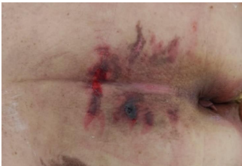
Slika 3.3.1.3.2. Drugi stupanj dekubitusa

Epidermis i dermis zahvaćeni su drugim stupnjem dekubitusa. Karakteriziran je stanjenjem kože, crvenilom koje napreduje do cijanoze te pojavom mjehura i blagog oštećenja kože [11]. U ovom stadiju najvažnija je njega kože te primjena različitih sredstava kako bi se spriječilo daljnje širenje [11].