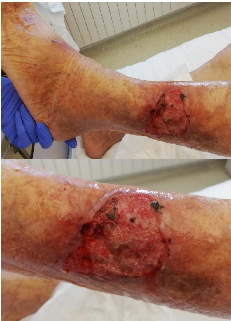
Slika 3.3.2. Venski ulcus

Venski ulcus najčešće nastaje na unutarnjoj strani distalne trećine potkoljenice, mjestu pritiska ili ranije traume, području pete i plantarnoj strani stopala [8]. Bolest započinje pojavom bule iz koje se javlja gnojna sekrecija. Na taj način nastaje kronična rana koja se s vremenom počinje širiti po površini kože. Cijeljenje rane je dugotrajan i intenzivan proces, a najvažnija metoda liječenja venskog ulcusa je primjena adekvatne kompresivne terapije [4, 15].