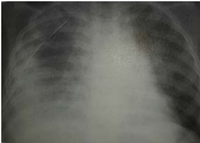
Slika 10.1.3 Pleuralni izljev [ Laura S.Inselman: Pediatric pulmonary pearls ]

Empijem je nalaz gnojnoga upalnoga eksudata u pleuralnome prostoru, uglavnom nastaje sekundarno u tijeku upalnih plućnih procesa, ali može nastati i iz drugih upalnih žarišta.