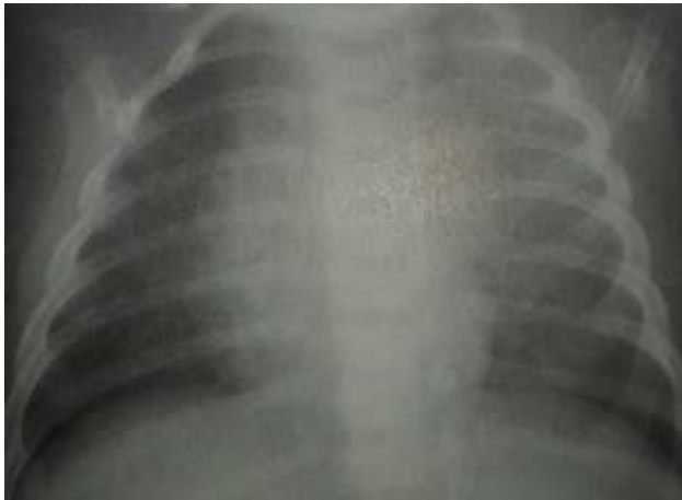
Slika 10.1.2. Pleuritis [Laura S.Inselman: Pediatric pulmonary pearls ]

Česta posljedica različitih upalnih i neupalnih intratorakalnih upalnih bolesti je pleuralni izljev, nakupljanje tekućine u pleuralnom prostoru. Pleuritis su samo izljevi koji su nastali kao posljedica upalnih procesa.[2]