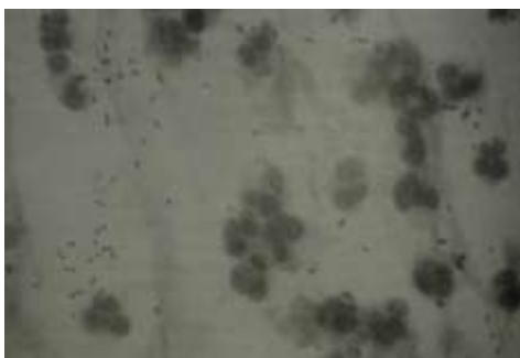
Slika 11.3.4 Gram-pozitivni pneumokoki u iskašljaju [Ilija Kuzman: Pneumonije , Zagreb, 1999.]

Sve uzorke treba pribaviti prije nego se započne liječenje antibioticima, ukoliko ima djelovanja antibiotika nalazi mikrobiološke pretrage su neadekvatni. Hemokulturu se preporučuje uzeti u sve febrilne djece jer imaju veliko dijagnostičko značenje ako su pozitivne.[1,2]