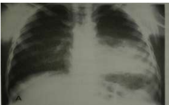
Slika 5.1 Bakterijska, pneumokokna pneumonia[Ilija Kuzman: Pneumonije, Zagreb, 1999.]

Bakterijske pneumonije, posebice, pneumokoknu karakterizira nagli nastup simptoma. Temperatura je umjereno povišena ili vrlo visoka, a u polovice bolesnika praćena tresavicom, redovito se pojavljuje i kašalj sa iskašljajem. Iskašljaj je gnojan, a nerijetko sadržava i primjese krvi. Relativno često je prisutna bol u prsima, pleuralni izljev i zaduha, a u teškim slučajevima i cijanoza. Probadanje i bol u prsima pojavljuje se u 50% bolesnika, a vrlo važni su simptomi za dijagnozu pneumonije i njezinu lokalizaciju. U nekih bolesnika nalaze se i simptomi gornjih dijelova dišnog sustava zahvaćenih upalom (hunjavica, promuklost, grlobolja...). U tim se upalama pluća, posebno u pneumokoknoj često pojavljuje i herpes na usnicama, prisutni su i opći simptomi infekcije. U težim pneumonijama, zbog pleuralne boli, zahvaćena strana zaostaje pri disanju. Bakterijska pneumonija se već u nastupu i tijekom bolesti puno češće kompliciraju od atipičnih, a najčešća komplikacija je pleuralni izljev.[2,3]