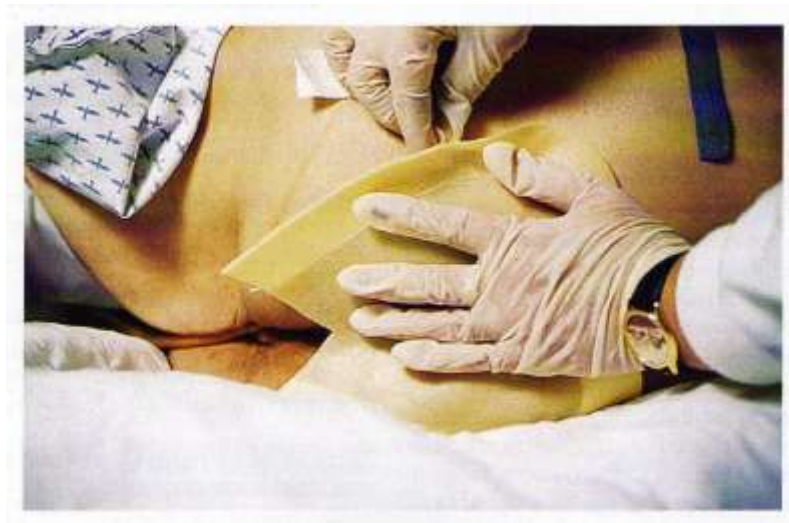
Slika 7.3.1.1. Pravilno apliciranje hidrokoloida sa samoljepivim rubom

Hidrokoloidi su okluzivni, samoljepivi oblozi (slika 7.3.1.1.) koji u strukturi imaju kombinaciju karboksimetilceluloze, želatine i pektina, a prekriveni su poliuretanskim filmom. Primjenjuju se za rane sa srednjom i slabijom sekrecijom. U kontaktu sa sekretom rane nastaje gel koji stvara optimalne uvjete za cijeljenje i potiče autolitički debridman stvarajući vlažan medij. Oblog se mora promijeniti kada gel procuri s ruba.