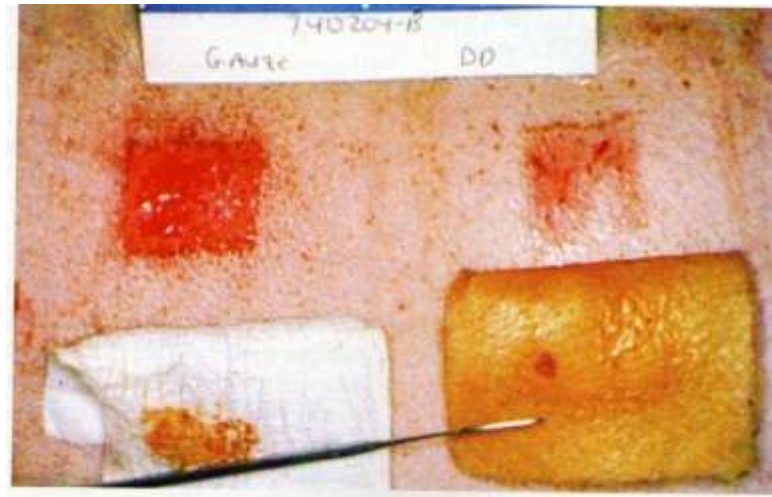
Slika 7.1.1. Brže zacjeljivanje rane s hidrokoloidom (desno) nego rane bez (lijevo).

gaze kroz isto razdoblje liječen