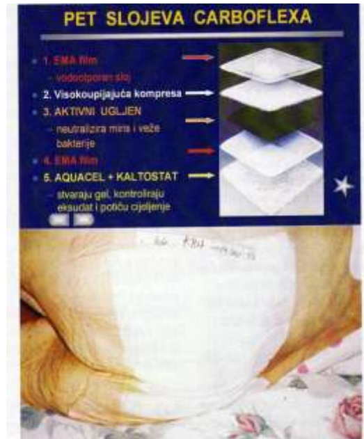
Slika 7.3.5.1. Struktura jednoga od obloga s aktivnim ugljenom

aplikacije i ritam izmjene takvoga obloga bitno se razlikuje kod obloga različitih proizvođača. To ovisi o strukturi obloga i o njegovim značajkama (slika 7.3.5.1.). Primjenjuje se tako da se nakon ispiranja rane fiziološkom otopinom izravno aplicira na ranu. Koristi se kod rana s jakom eksudacijom i intenzivnim mirisom.