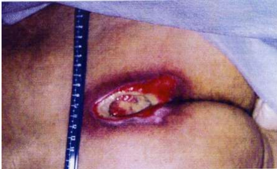
Slika 2.4. Stadij 4. Dekubitalni vrijed na sakrumu