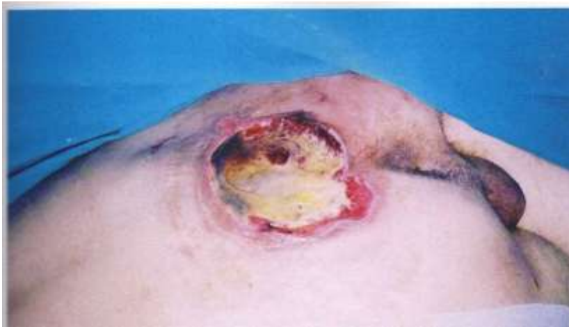
Slika 2.3. Stadij 3. Dekubitus na sakrumu prekriven nekrozama

Potpuni gubitak debljine tkiva. Potkožno masno tkivo može biti vidljivo, ali kost, tetiva ili mišić nisu izloženi/obuhvaćeni. Mrtvo tkivo može biti prisutno, ali ne zasjenjuje debljinu gubitka tkiva (slika 2.3.). Dubina dekubitusa varira prema anatomskom položaju. Most nosa, uho, zatiljak nemaju potkožno tkivo pa treći stadij može biti plitki. S druge strane, na područjima veće debljine mogu se razviti izuzetno duboki dekubitusi trećeg stadija. Kost i tetive nisu vidljive ili izravno opipljive [4].