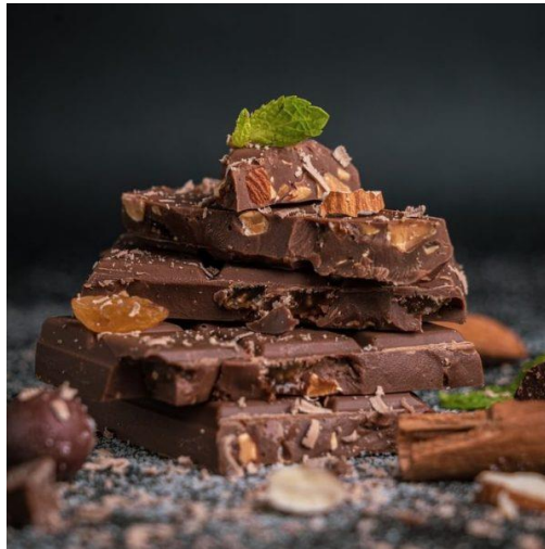
Slika 15. Čokolada s koprivom, izvor: https://soulfood.hr/napravite-sami-svoju-cokoladu/

Tako se i kopriva istražuje kao funkcionalni dodatak - za korištenje u konditorskoj industriji pri čemu je veoma važno optimizirati uvjete ekstrakcije kako bi u konačnom ekstraktu koji se dodaje u proizvod bila očuvana maksimalna količina funkcionalnih sastojaka koji su najčešće iz skupine polifenola [30].