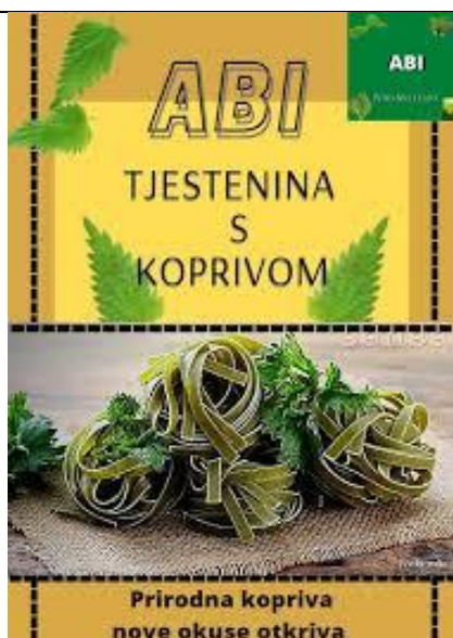
Slika 18. Tjestenina s koprivom

Za pripremu tjestenine od koprive najčešće se koriste durum griz i liofilizirana trava koprive, no postoje različiti načini proizvodnje koji ovise o recepturi proizvođača [36, 37]. Tjestenina s koprivom (rezanci i pužići ) prikazana je na Slici 18 i 19.