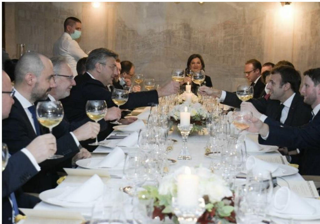
Slika 2. Radna večera francuskog predsjednika i hrvatskog premijera u restoranu u Zagrebu