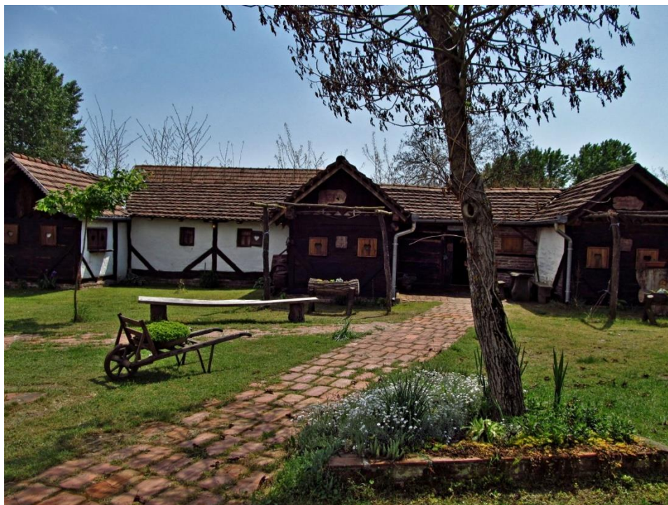
Slika 5. Etno kuća obitelji Karlovčan, Brodić, izvor: Turistička zajednica Koprivničko – križevačke županije

Etno zbirke su specijalna vrsta „muzeja“ u kojem se sakupljaju, čuvaju, izlažu, proučavaju, objavljuju te populariziraju predmeti i druge vrste dokumenata koji svjedoče o načinu života i kulturi pojedinih ljudskih zajednica ili društava u različitim povijesnim razdobljima. U Koprivničko – križevačkoj županiji brojimo 4 etno zbirke, a to su: Etno – kuća Večenaj, Etno muzej Slavko Čamba, Etnografska zbirka Josipa Cugovčana, Etno kuće obitelji Karlovčan.