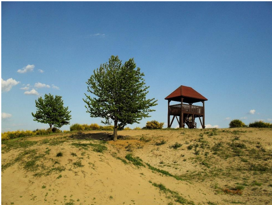
Slika 4. Đurđevački pijesci

Đurđevački pijesci – posebno –geografski botanički rezervat, jesu posljednji, nepošumljeni ostatat dugog pojasa Podravske pijesaka, tj. „Hrvatske Sahare“. Cilj je očuvati preostali dio pješčanih naslaga.