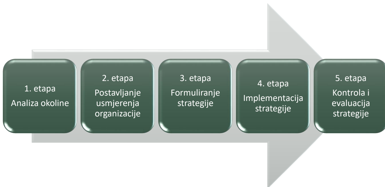
Slika 1. Etape strateškog menadžmenta

Za početak procesa strateškog menadžmenta potrebno je odraditi analize unutarnje i vanjske okoline koju je moguće izraditi pomoću SWOT analize te PASTEL analize. Kroz drugu etapu potrebno je analizirati misiju, viziju, ciljeve i planirane strategije poduzeća. Sljedeći korak je najvažniji jer se u njemu formulira strategija koje će se ubuduće koristiti u samom poduzeću. U četvrtoj etapi implementiramo strategiju koju smo odlučili koristiti, te u petoj etapi kontroliramo i ocjenjujemo uspješnost implementirane strategije.