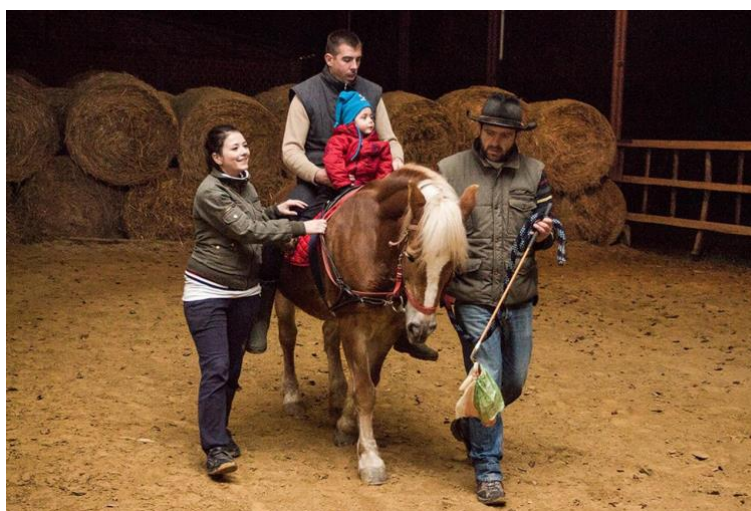
Slika 3.9.1 Prikaz sujahanja

Uloga sujahanja je pomoći u održavanju pravilnog položaja sjedišta i obratiti pažnju na položaj zdjelice. Ako je zdjelica nagnuta previše unatrag, sukorisnik primjenjuje nježan pritisak palcem na zdjelicu korisnika kako bi ju potaknuo da se pomakne prema naprijed. Ako je suprotno, sukorisnik koristi svoje ruke da povuče zdjelicu unatrag. Isto tako, jedan od ciljeva sujahanja je osigurati oslonac za glavu i trup korisnika te bi korisnika trebalo postupno poticati na samostalno održavanje ravnoteže. Slika 3.9.1 prikazuje sujahanje [24].