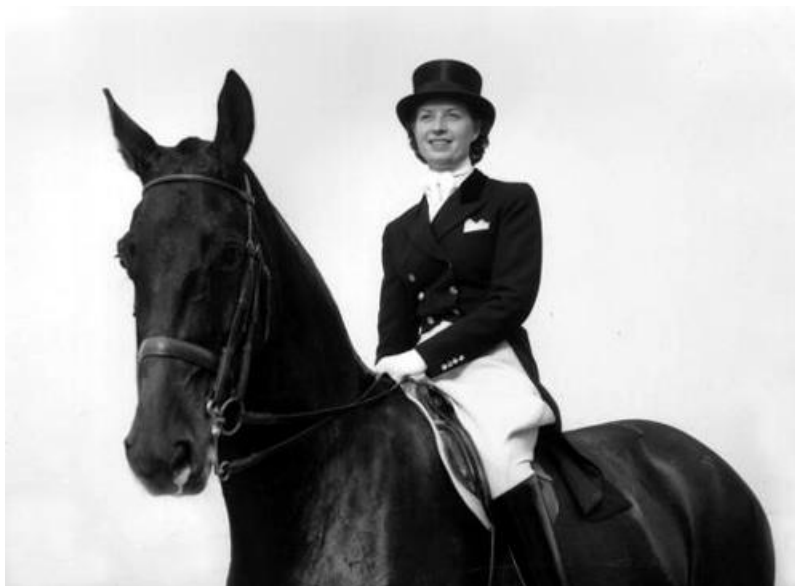
Slika 2.5.1 Liz Hartel

dijete, prilagoditi aktivnosti i okolinu njegovim potrebama, što pridonosi boljoj integraciji djeteta u svakodnevni život i zajednicu[15]. Slika 2.5.1 prikazuje Liz Hartel.