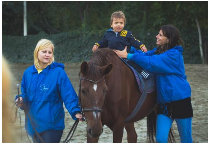
Slika 3.1.1 Terapijsko jahanje