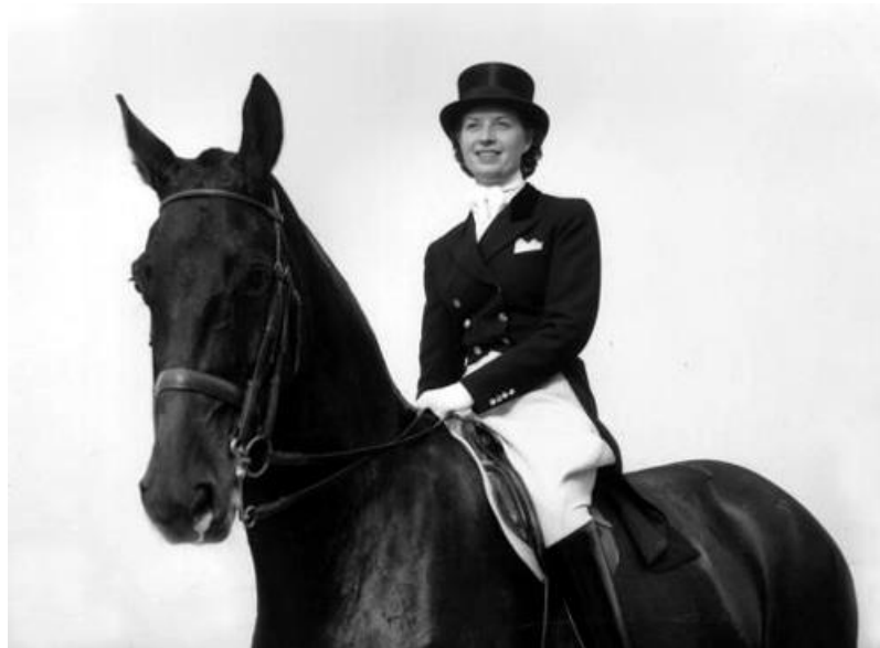
Slika 2.5.1 Liz Hartel

dijete, prilagoditi aktivnosti i okolinu njegovim potrebama, što pridonosi boljoj integraciji djeteta u svakodnevni život i zajednicu[15]. Slika 2.5.1 prikazuje Liz Hartel.