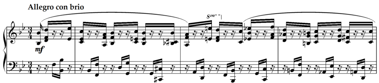
Primjer 4.4.1. Početak treće varijacije (taktovi 1-3)

Treća varijacija (taktovi 1-32) koja ima također trodijelni oblik u tonalitetu B-dura, karakterizirana je brzim tempom označenim kao „Allegro con brio“. Ova varijacija koristi bogatstvo tematskog materijala iz Mozartovog originalnog menueta, s posebnim naglaskom na ritmičku razradu. U čitavoj varijaciji ističe se relativna ritmička promjena, izrazito prisutna u šesnaestinskim notnim vrijednostima unutar \frac{3}{4} metra, čime se postiže stalna napetost i pokretljivost unutar formalne strukture.