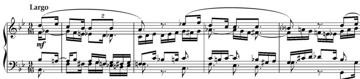
Primjer 4.5.1. Početak četvrte varijacije s relativnim ritamskim i melodijskim promjenama u četveroglasnoj strukturi (taktovi 1-4)

U četvrtoj varijaciji, Rikard Schwarz razrađuje tematski materijal prvog dijela (a) Mozartovog prvog menueta, smještenog u 9/16 mjeru i tonalitet B-dura. Varijacija započinje četverotaktnom frazom (taktovi 1-4), u kojoj se odmah očituje skladateljeva igra s ritmičkim aspektima vodeće melodije. U unutarnjim glasovima prisutni su prohodi i izmjenični tonovi, što dodatno obogaćuje zvučnu teksturu.