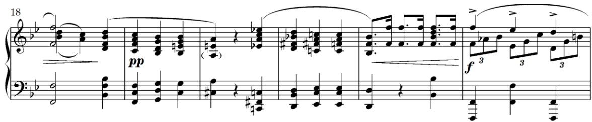
Primjer 4.3.3. Ponavljanje prvog dijela u drugoj oktavi (taktovi 18-23)

Ova varijacija može se smatrati strogom zbog vjernog zadržavanja formalne strukture (||: a :|| b a :||) i tonalnih odnosa. Međutim, istovremeno je i karakterna, jer promjena tempa značajno mijenja njezin izraz. Sporiji tempo omogućava dublju ekspresivnost, gdje alterirani akordi i produženi ritmički odnosi stvaraju kontemplativniju atmosferu. Iako formalno precizna, varijacija postiže snažan emotivni kontrast kroz suptilne harmonijske i ritmičke promjene.