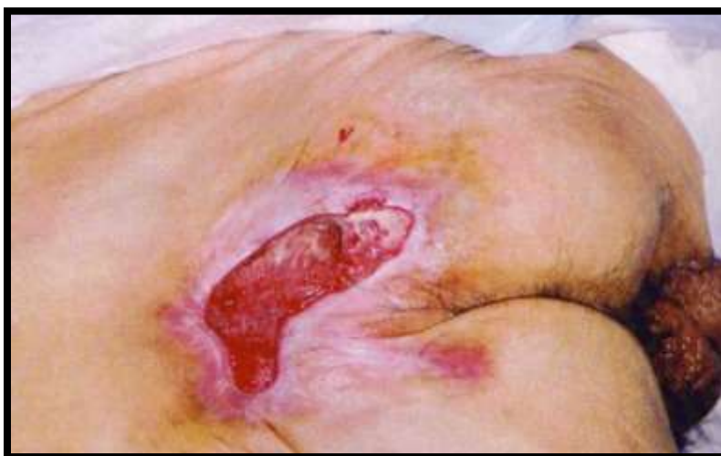
Slika 3.2. Stadij 2. Dekubitusa s torpidnim rubovima i granulacija

Dolazi do stanjenja kože koje zahvaća sve slojeve. U ovom stadiju nastaje površna rana. Karakteriziran je pojavom abrazije, mjehura ili plitkog katetera. Kada dođe do očitih promjena na koži, tada se očekuju i mogo opsežnije promjene na muskulaturi i ovojnicama mišića. [1] (slika 3.2.)