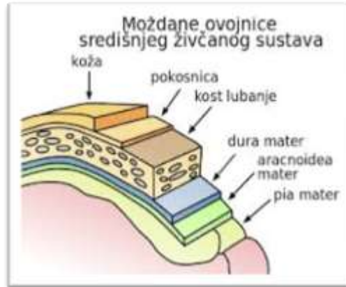
Slika 0. Moždane ovojnice središnjeg živčanog sustava [11]

čvrsta i nije jednako debela na svim mjestima. Dura mater tvori duplikature koje pregrađuju šupljinu lubanje. FALX CEREBRI – je duplikatura tvrde moždane ovojnice koja se nalazi između hemisfera velikog mozga. Smještena je u sagitalnoj ravnini i srpolikog je oblika.