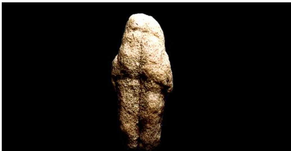
Slika 1. Figurica iz Tan-Tana, Maroko.

Figurica iz Tan-Tana, iz ašelskog razdoblja, stara 500.000 do 300.000 godina. Cjelokupni oblik ovog malog šljunčanog kamena sličij ljudskom liku. Prirodnog je materijala i čovjek ga nije mjenjao. Pronađen je u blizini kamenih alata. Moguće je da ga je sačuvao netko tko je primjetio njegov ljudski oblik. Ispitivanja pod mikroskopom govore da je ljudska ruka oblik tijela figurice vjerojatno dodatno, namjerno naglasila. Figurica je pronađena u Maroku. Visina joj je 5,8 cm, širina 2,6 cm i debljina 1,2 cm. 16