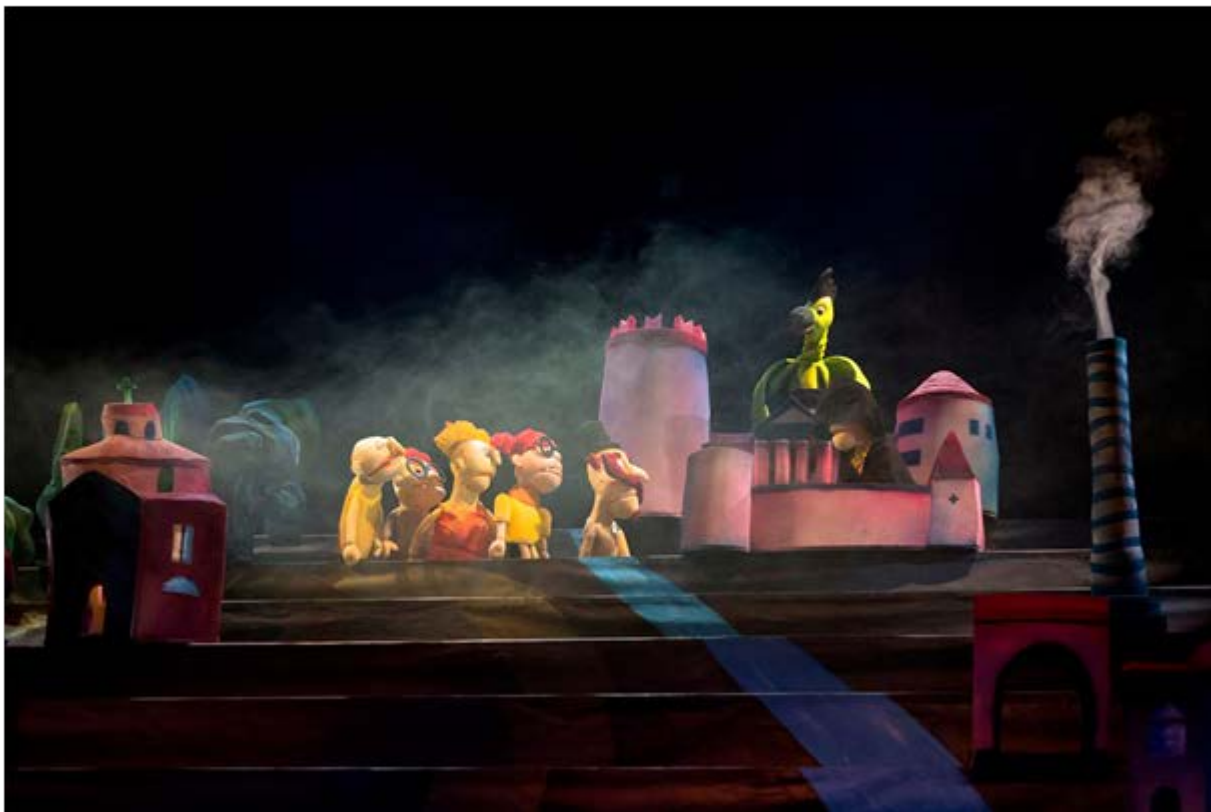
Slika 5: Prizor 2 iz lutkarske predstave „Trsatski zmaj“ (Gradsko kazalište lutaka – Rijeka, n.d.)

Iz slika 4. i 5. vidljivo je upravo ono što govori Špindel (Špindel, 2016: 10) o inspiraciji u smislu vizualnog identiteta lutaka. Jim Henson, genije lutkarstva kojem je „Muppet Show“ samo najpoznatije djelo, osmislio je lutke koje izgledaju vrlo slično dizajnu lutaka u predstavi „Trsatski zmaj“, ali ako pronalazimo mjesto gdje je ova predstava posebno značajna u vizualnom smislu, onda je to svakako spajanje scenografije i kostimografije. Upravo su iz tog razloga za prikaz u ovom radu odabrane slike 4. i 5. Ako pažljivije promotrimo fotografije i usporedimo scenografiju s kostimografijom, shvatit ćemo da se tu pojavljuju dva različita utjecaja. Osim Hensona, onaj drugi bi nam također trebao biti poznat.