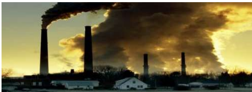
Slika 5. Utjecaj industrije na onečišćenje zraka