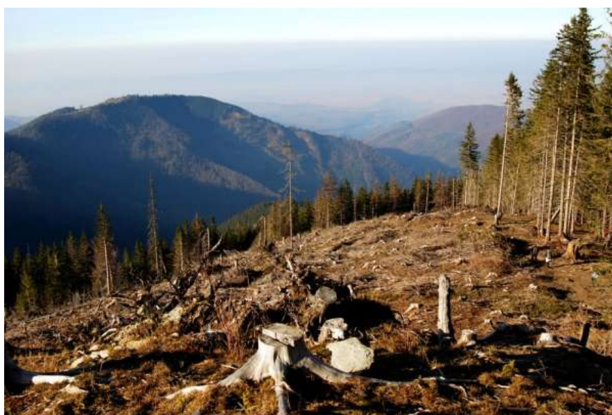
Slika 6. Deforestacija