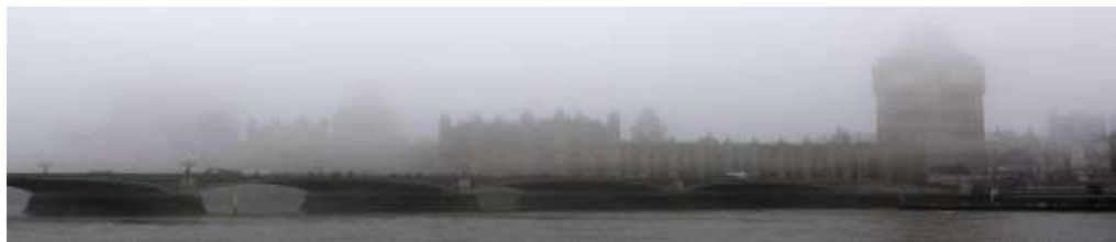
Slika 11. London, 1952. godine