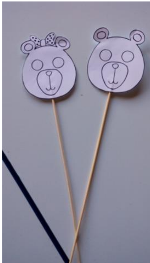
Slika 10: Lutke medvjeda i medvjedice za izvođenje igrokaza „Zdrava prehranama“