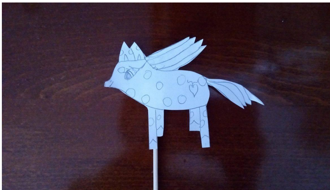
Slika 11. Lutka djevojčice A. J. (6 godina i 4 mjeseca)

Nakon što su djeca završila s izradom lutaka na štapu svako sam dijete zamolila da mi kaže ime svoje životinje i zašto je baš odabrao životinju koju je nacrtao. U nastavku donosim analizu pet odabranih radova.