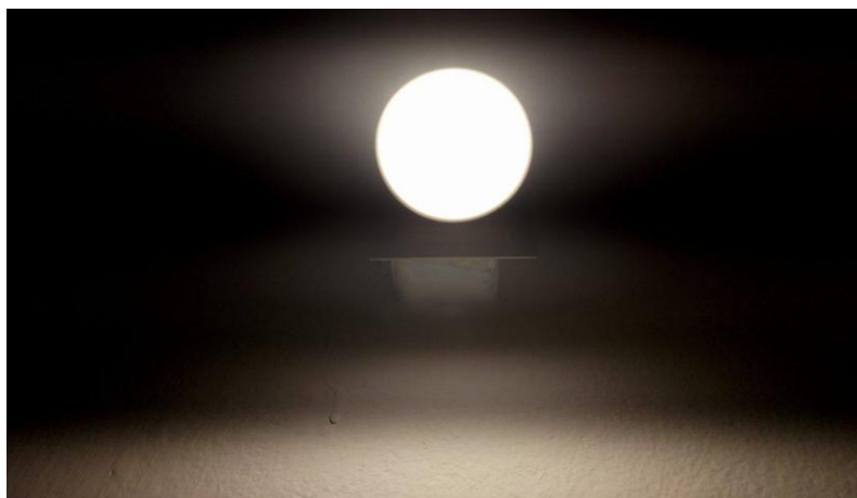
Slika 1. Svjetlost

Svjetlost možemo definirati kao zračenje, a svima je znana kao pojava pomoću koje možemo vidjeti. Ljudi ju često olako shvaćaju kao uobičajenu pojavu ne imajući na umu njezinu vrijednost. Djeca bi se već u najranijoj dobi trebala susresti s definicijom svjetlosti kroz razne aktivnosti i animacije koje su prilagođene njihovom uzrastu. Svjetlost dobivamo korištenjem sunčeve svjetlosti ili samostalnim stvaranjem svjetlosti koja je dobivena na umjetan način korištenjem raznih predmeta koji su dostupni ili predmeta koje možemo sami izraditi. Djeci valja objasniti da svjetlost možemo vidjeti pomoću naših očiju koje nam omogućuju razlikovanje boja koje se pojavljuju unutar svjetlosti. Njezinim isijavanjem vidimo boje među kojima su najčešće: ljubičasta, plava, zelena, žuta, narančasta i crvena. Svjetlost možemo stvoriti pomoću žarulja, vatre, baklje i raznih drugih predmeta. U dječjem vrtiću možemo primjerice koristiti žarulje koje ćemo postaviti unutar neke lampe koja će se uključiti u strujni krug i na taj način omogućiti osvjetljavanje prostora koji je prekriven tamom. Proučavajući svjetlost djeca mogu uočiti da će, ukoliko postave neki predmet ili pomoću tijela prekriju dio svjetlosti, nastati tama, odnosno sjena koja će njima biti nepoznat pojam.