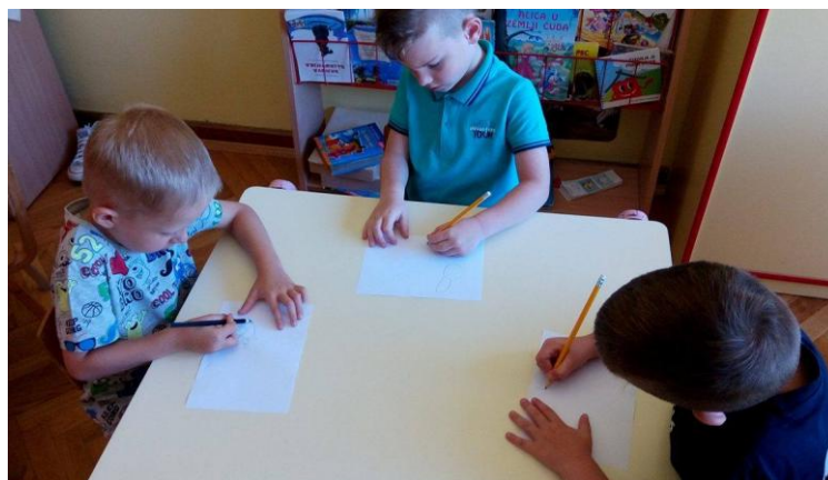
Slika 7. Izrada lutaka u DV

Izvor: fotografirala Petra Peršić, 3. 7. 2017.