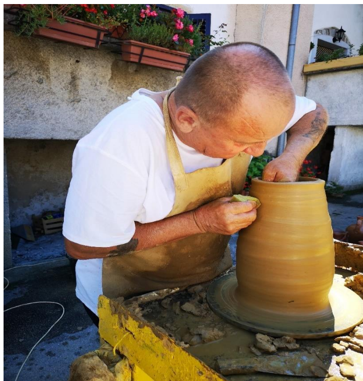
Slika 3. Demonstracija izrade lončarskih proizvoda (Buzet: 2018)