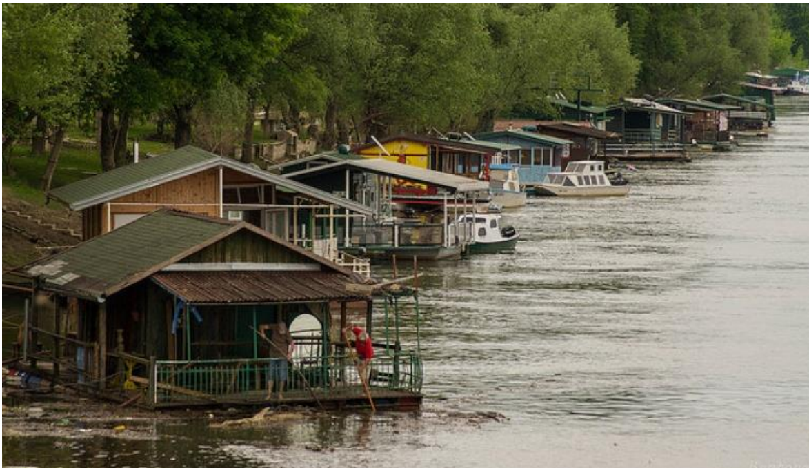
Slika 1. Splavarska ulica u Slavonskom Brodu