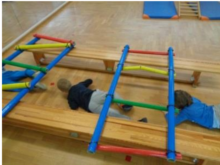
Slika 3. Puzanje djece predškolske dobi

Puzanje pripada djeci jasličke dobi, a utječe pozitivno na snagu i razvoj svih mišićnih skupina, na pokretljivost kralješnice, zglobova i razvoj koordinacije. Intenzivno se pojavljuje sa šest mjeseci te se usavršava tijekom prve godine djetetova života. Kao osnovno puzanje, pretvara se u izvedenice kao što su provlačenje, četveronožno hodanje, a omogućuje sjedanje i stajanje. Nakon što djeca usavrše puzanje, počinju savladavati te upoznavati prostor oko sebe, a samim time se krenu i provlačiti i zavlaciti (ispod kreveta i krevetića, u otvoreni ormar...). Za djecu zavlacanje i provlačenje su vrlo naporni, ali pozitivno utječu na razvoj mišića trupa, ramenog pojasa i ruku. Kao kineziološki sadržaj, puzanje se najčešće sa djecom provodi ležeći na truhu, boku ili leđima. Također, može se provoditi i u različitim smjerovima (naprijed, nazad, s promjenom smjera, itd.) (Neljak, 2009).