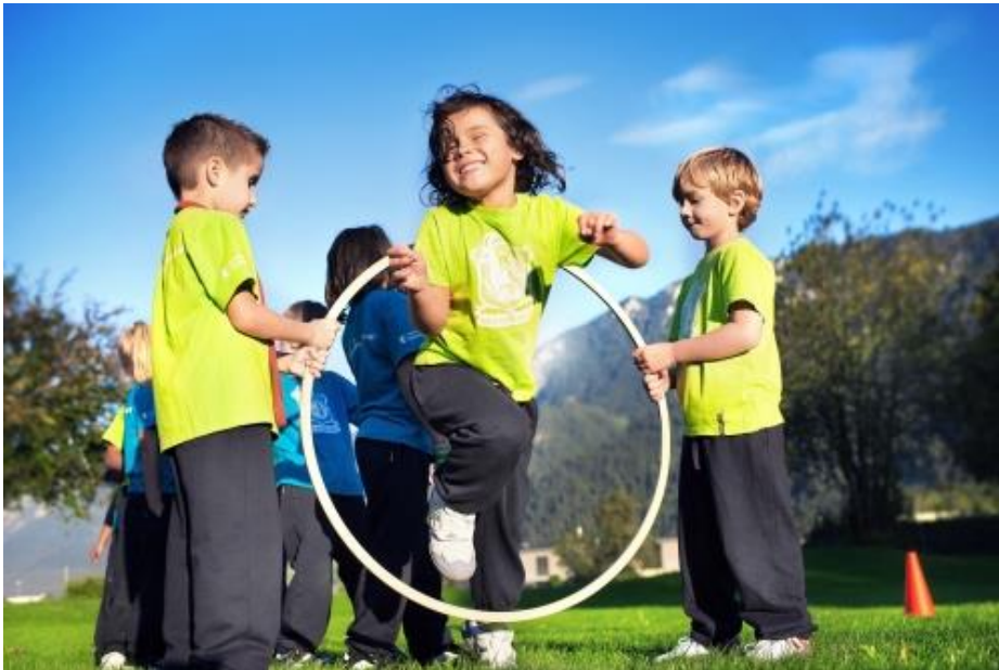
Slika 1. Tjelesna i zdravstvena kultura djece predškolske dobi

U posebnim ciljevima tjelesne zdravstvene kulture naglašava se kako je važno formirati tjelesno dobro i skladno te zdravo razvijeno dijete koje može slobodno vladati motorikom, razvijati osjetljivost djeteta te važnost poticanja razvoja zdravstvene kulture zbog očuvanja i unaprjeđivanja zdravlja (Findak,1995).