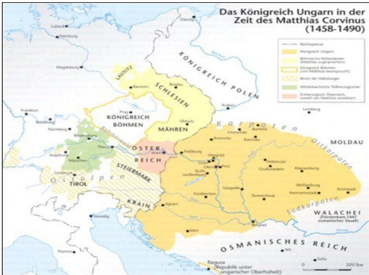
Slika 1. Ugarsko Kraljevstvo u vrijeme Matijaša Korvina (1458. – 1490.)

prihodi krune u prvim godinama vladavine udvostručili, a na kraju vladavine prihodi su iznosili od oko 800 do 900.000 zlatnih florina 62 .