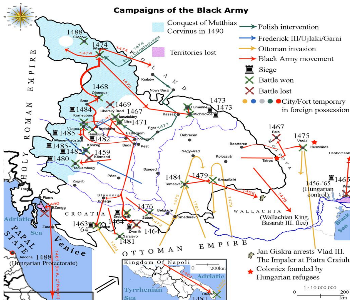
Slika 3. Ratovi Matijaša Korvina (1458. – 1490.) s prikazom pohoda protiv Austrije

Kralj Matijaš Korvin, kao što je u prijašnjem poglavlju opisano odmah nakon izbora za kralja došao je u sukob sa svatorimskim njemačkim carem Fridikom III. Nakon pomirbe, sklapanja ugovora i vraćanja krune, Matijaš i Fridrik III. često su se otvoreno ili prikriveno sukobljavali. Njihovi međusobni odnosi dodatno se pogoršavaju 1477., kada ponovno kreću u međusobni rat koji traje sve do 1485. godine. Nakon osvajanja Beča, Matijaš svojom vojskom osvaja Štajersku i Donju Austriju, a svoje sjedište seli u Beč. 79