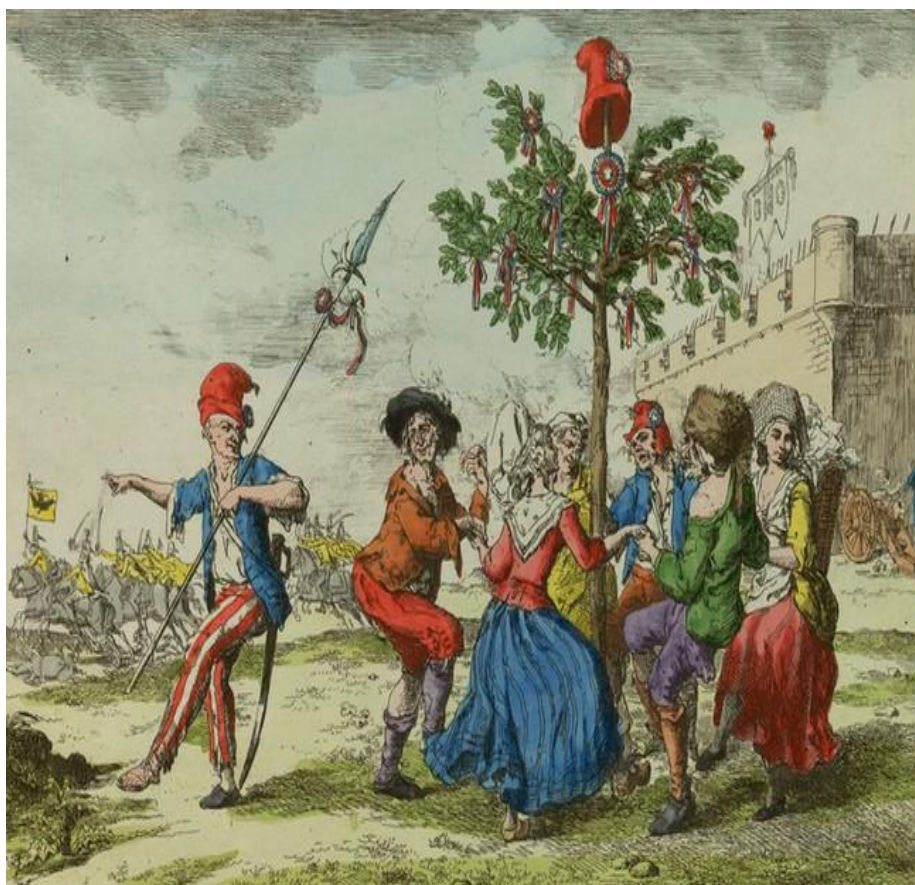
Slika br.6 Prikaz plesa na pjesmu La Carmagnole