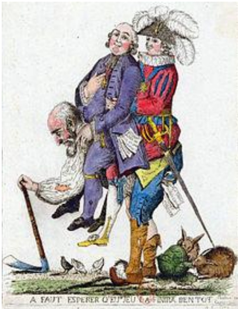
Slika br.3 Primjer satirične karikature potlačenog Trećeg staleža