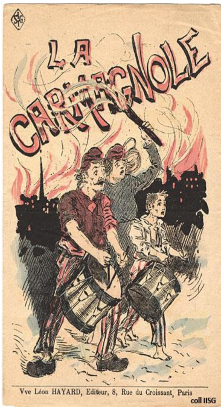
Slika br.7 Plakat povodom Francuskog nacionalnog festivala