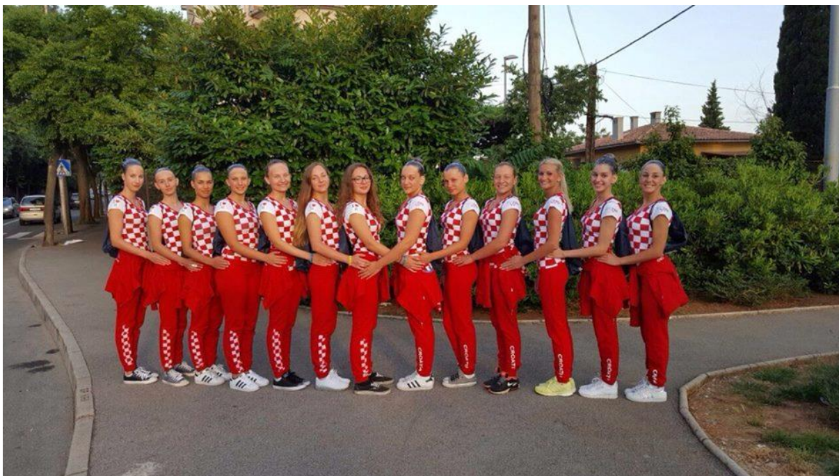
Slika 9. Reprezentacija umjetničkog plivanja u Hrvatskoj

Autorica ovog rada vjeruje kako će uz veće marketinške napore ovaj sport biti popularniji. Trud i rad sadašnjih članica Hrvatskog saveza za sinkronizirano plivanje neosporan je, međutim uvijek ima prostora za rast i napredak.