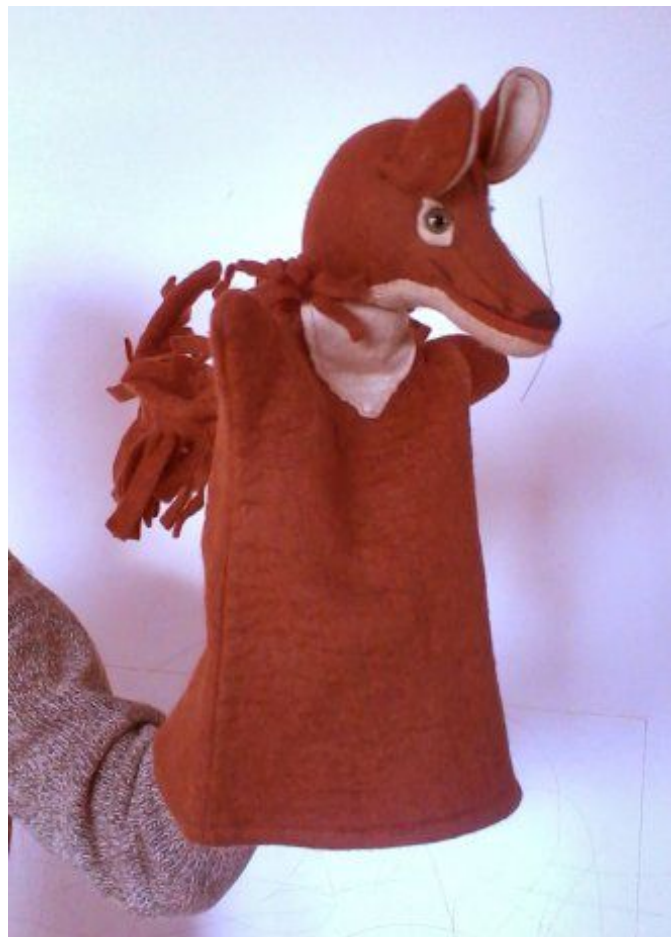
Slika 1. Ginjol

Sudbina ove lutke nastaje i nestaje u trenutku kad navučena na ruku lutkara poput rukavice progovara sebi svojstvenim jezikom, jezikom lutke što ga razumiju svi ljudi, jer osjećaju da to biće bez identiteta koje započinje svoj život na pozornici u jednom trenutku opravdati svrhu svog postojanja.