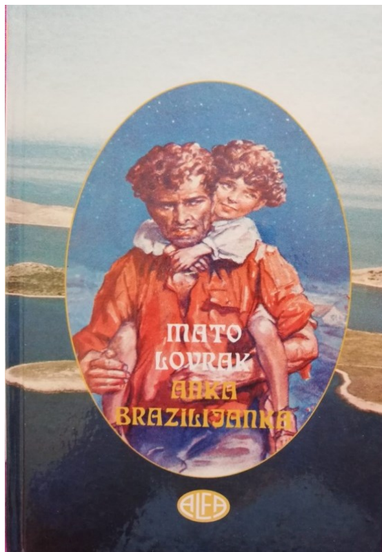
Slika 1: Naslovnica knjige Mate Lovraka Anka Brazilijanka u izdanju Alfe iz 1995.