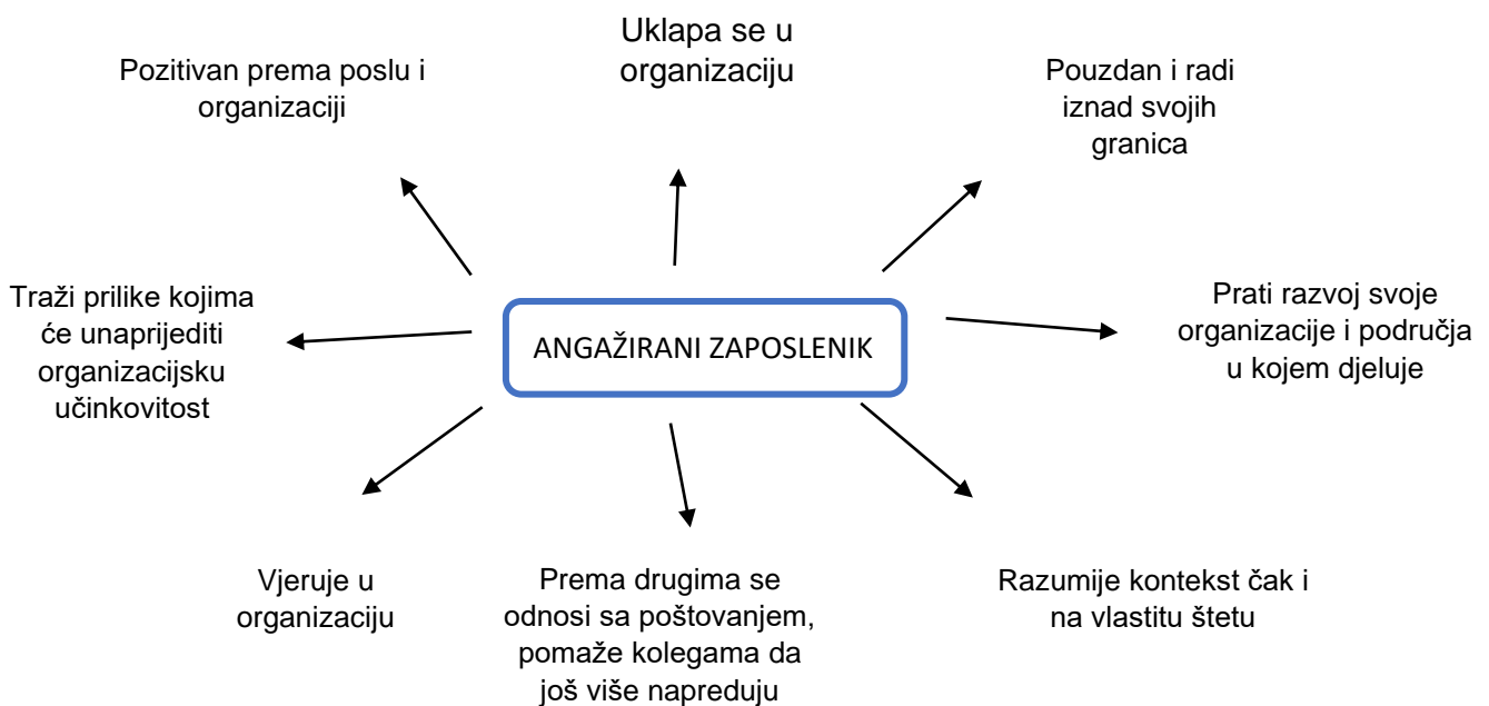
Slika 1. Karakteristike angažiranog zaposlenika

Izvor: D. Robinson, S. Perryman, S. Hayday(2004.): The Drivers of Employee Engagement, str. 6 https://www.employment-studies.co.uk/system/files/resources/files/408.pdf