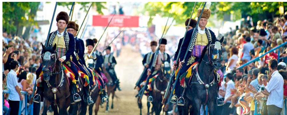
Slika 14. Sinjska alka

Sinjska alka održava se od 1717. godine te je samo jedanput bila odgođena na više mjeseci zbog kolere (1855. godine), a tijekom Drugog svjetskog rata nije se održavala (osim 1944. godine). Dan održavanja alke nakon Drugog svjetskog rata je prva nedjelja u kolovozu.