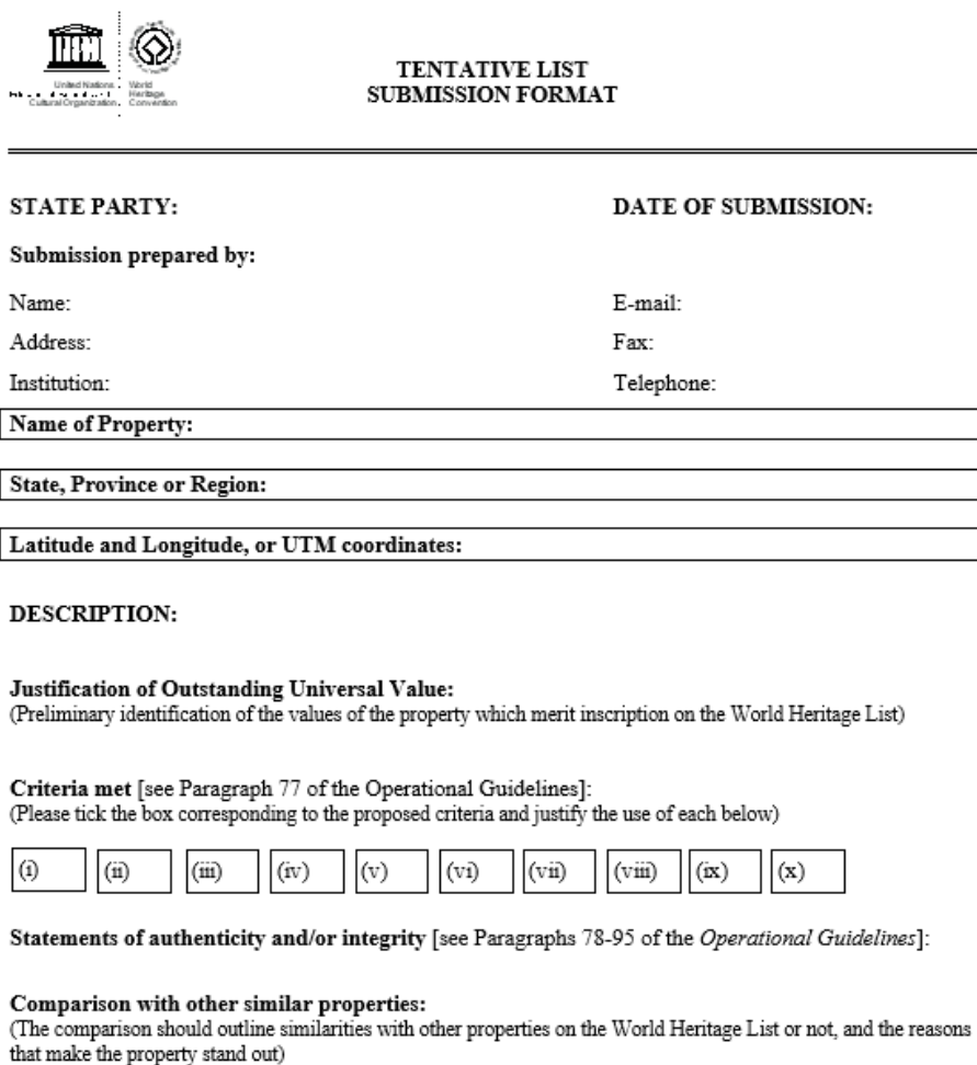
Slika 16. Dio dosjea za podnošenje Tentativne liste ( http://whc.unesco.org )

„UNESCO-ov Savjet prema predanim podacima odlučuje je li lokalitet doista vrijedan nominacije. Od vlade države koja nominira lokalitet zahtijeva se da ima pravne i regulatorne okvire te mehanizme upravljanja kojima bi mogla poduprijeti samu nominaciju.“ (Jelinčić, 2008: 89). Države potpisnice trebaju se preispitati i ponovno dostaviti svoju Tentativnu listu u roku od najmanje svakih deset godina. Kulturno ili prirodno dobro, jednom upisano na Listu svjetske baštine, miče se s popisa Tentativne liste.