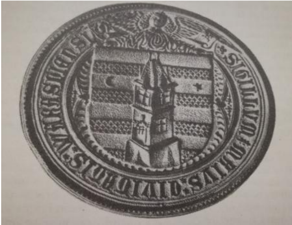
Veliki pečatnjak Varaždina, 1464. 44

Matiju Korvina naslijedio je nezakonit sin Ivan Korvin, kojeg mu je rodila Marija. Posljednjih je godina vladavine Matija svog sina vodio svugdje sa sobom da ga upozna s vladarskim dužnostima. Ivan Korvin nosio je titulu "Herceg opavski i liptovski, te grof hunjadski". 45 On je nakon očeve smrti bio jednim od najozbiljnijih kandidata za upražnjeni tron Ugarsko-Hrvatskog Kraljevstva. Iako je narod u njemu vidio sliku i priliku samog Matije, velikaši su i baruni Kraljevstva s prelatima izabrali drugog kandidata za kralja – poljskog princa i češkog kralja Vladislava II. Jagelovića. Želja hrvatskih staleža bila je da Ivan bude na čelu hrvatskih zemalja pa ga je na proljeće 1495. kralj Vladislav II. imenovao banom Dalmacije, Hrvatske i Slavonije, a ponudio mu je i naslov kralja Bosne pod uvjetom da Osmanlijama preotme Bosnu. 46 Ivan Korvin se potom oženio Beatricom Frankapan u ožujku 1496. godine, 47 kćerkom najuglednijega i najmoćnijeg hrvatskog velikaša, grofa Bernardina