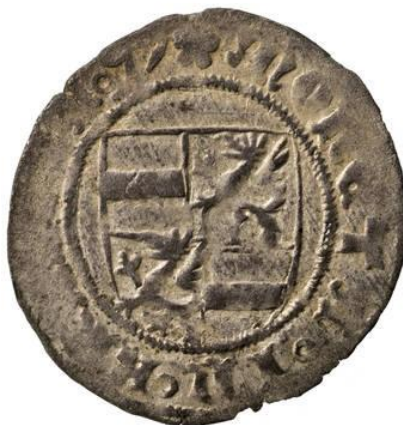
Krajcar bana Jana Vitovca (1459.) 59

Od njemačkog izraza kreuzer (križ). Novčić je nazvan prema dvostrukom križu koji se nalazi na naličju. Sitan novac, mjeden i različite vrijednosti. U XIII. i XIV. stoljeću su se kovnice nalazile u Meranu (Južni Tirol) te u Veroni. Kod nas se krajcar najviše koristio od 1527. godine te isto tako kada je Ferdinand II. bio okrunjen kao hrvatski i slavonski kralj. 58