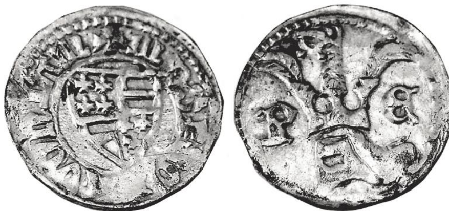
Slavonski banski denar hercega Stjepana (1353.) 57