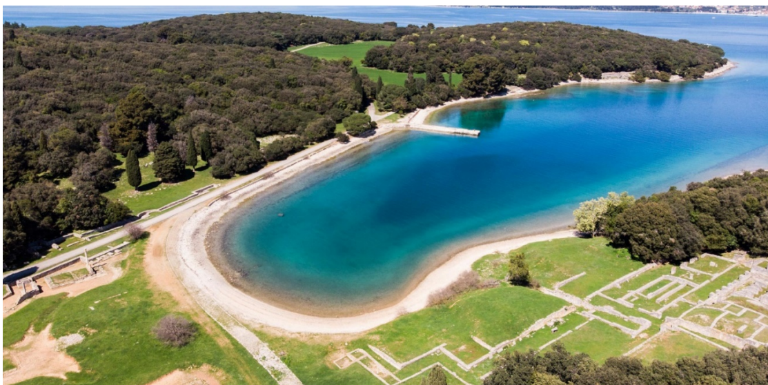
Slika. 12. Uvala Verige na Brijunima