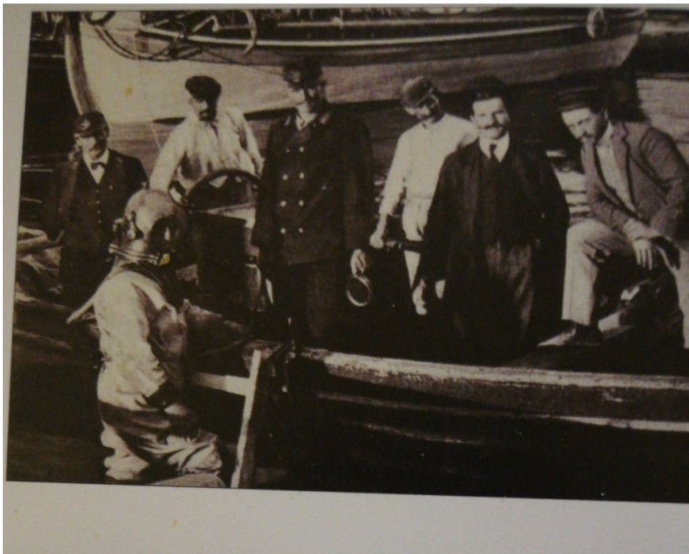
Slika 7. Brod „Laudon” i austrougarski admiralitet