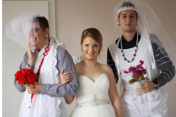
Slika 6: „Lažna mlada“

prije mlade izvedu dvije ili tri djevojke, koje se nazivaju „lažne mlade“ (sl. 6.), a slijedi ih sama mladenka, za koju djever ili kum daju dogovoreni iznos novca. Taj običaj i danas nalazimo na vjenčanjima. 10