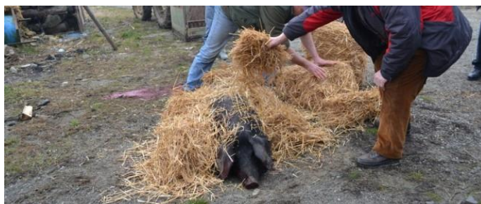
Slika 2: Tradicionalno kolinje